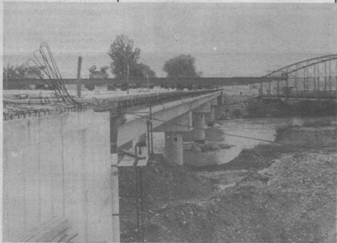
Novi most se, v nasprotju s starim, ne samo staplja z okoljem, temveč mu je celo v okras. Taka naj bi bila vsa arhitektura prihodnosti.