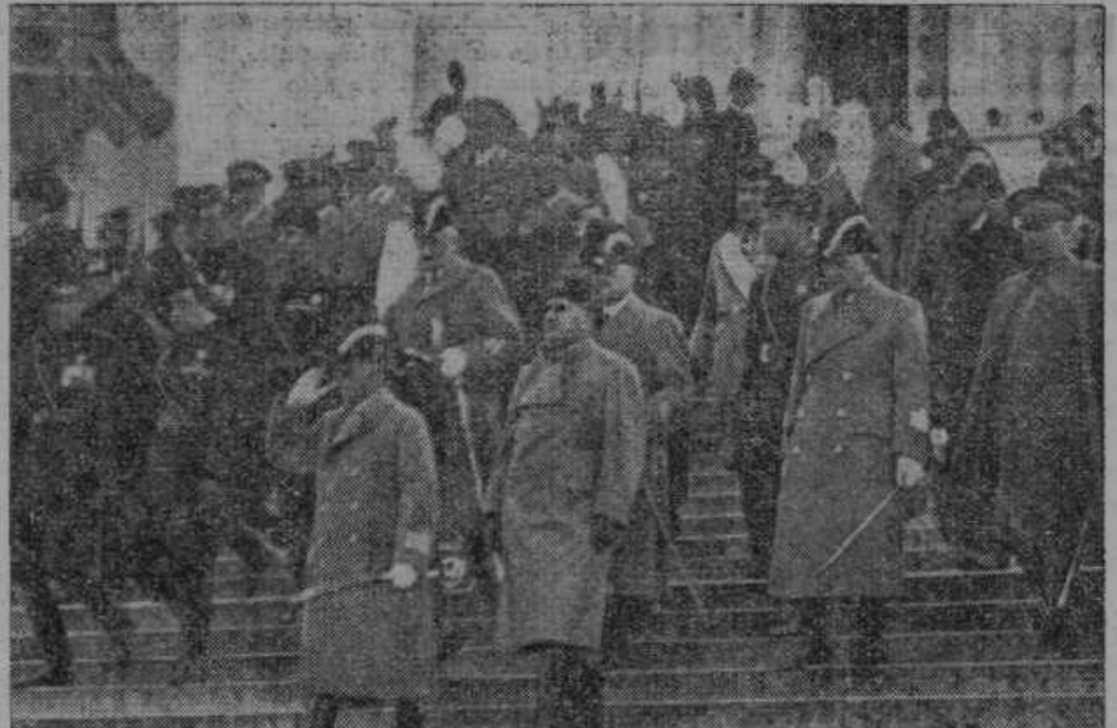
Italijanski kralj in Mussolini sta se poslovila od dveh polkov, ki sta določena za vzhodno Afriko in sta na potu h grobu neznanega vojaka.

Smarje pri Jelšah. V nedeljo, 26. januarja, priredi naša Sadjarska podružnica predavanje,