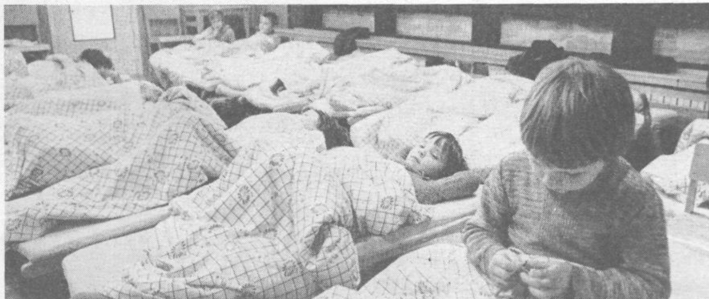
Starši vsako leto dražje plačujejo to, da so lahko dopoldne na svojem delovnem mestu mirni in brez skrbi, saj vedo, da je malček v vrtcu v dobrih in skrbnih rokah.

Seveda pa so razlike med enim in drugim vrtcem občutne. Tako je predlagana