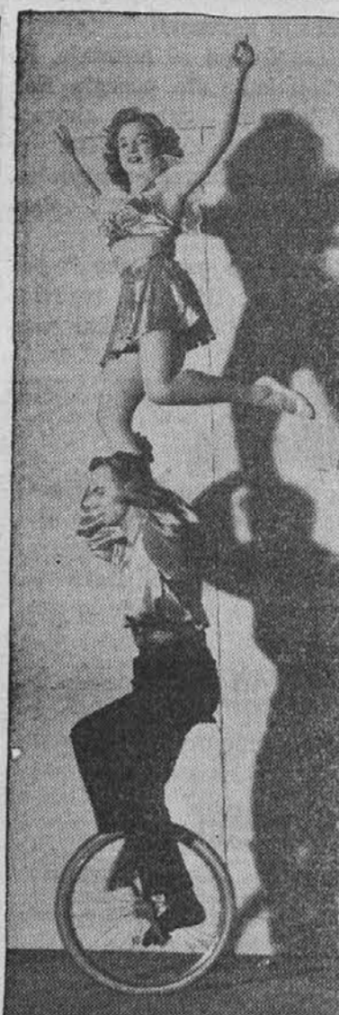
"Hi-Yo Silver" se bo razlegal klic po prostorih Cleveland Arena, ko bo podajal svoje predstave dvakrat na dan (popoldne in zvečer) Arena Cirkus od 7. do 14. januarja.

posekal, če bi mu s zvižajo utrgal tisti gumb. In ni se zmotil. Ko je učitelj spet vprašal odličnjaka nekotovar, siromak ni mogel najti prijaznega gumba in to ga je tako zmešalo, da ni mogel odgovoriti. Nato je bil vprašan Walter Scot, ki je tako gladko odgovoril, da je prišel na prvo mesto in postal odličnjak. Najvišje ležeča dežela na svetu je Tibet, katere mizaste pokrajine se vzdigujejo do 16,000 čevljev nad morsk gladino.