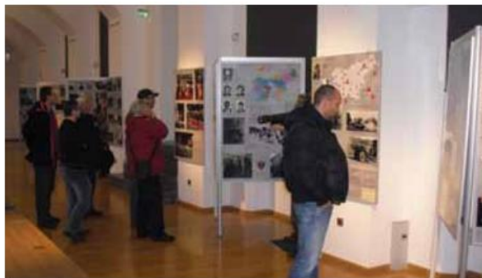
Obisk članov Zgodovinskega društva Kidričevo v kadetnici.