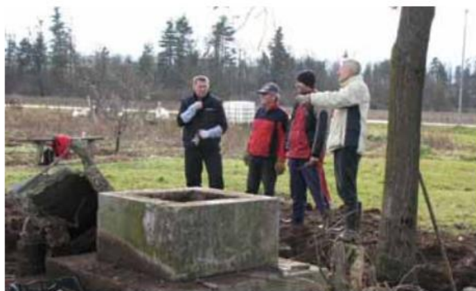
Med izkopom fragmentov spomenika pri dvorcu Sternthal.

Ena izmed prvih aktivnosti društva je bila postavitve priložnostne razstave Portreti ruskih vojakov, posvečena spominu na rusko ujetniško in kasneje rusko begunsko taborišče v Strnišču, ki