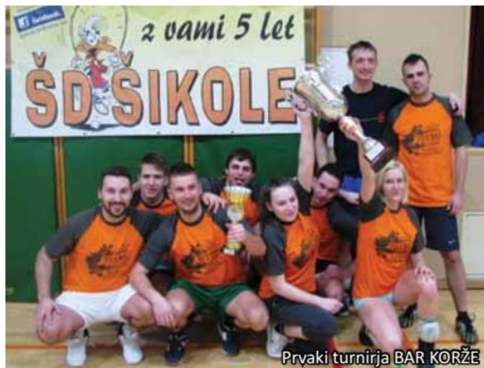
Prvaki turnirja BAR KORŽE

Drugi dogodek smo organizirali v nedeljo, 9. marca, v domači šikolski dvorani. V ponos nam je bilo gostiti največjega slovenskega bontonologa SAŠA ŽUPANEKA iz Murske Sobote. Pripravil nam je poučno zabavno predavanje o bontonu na splošno (rokovanje, pozdravljanje, olika ...). Vse pa nam je prikazal na duhovit način z obilico humorja ... marsikaj je povedal v prekmurščini, kar je bilo še nadvse zabavno. V lepem popoldanskem popoldnevu se je dvorana skoraj v celoti zapolnila, bilo