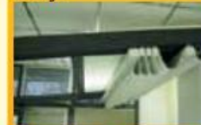
Pergola - tenda