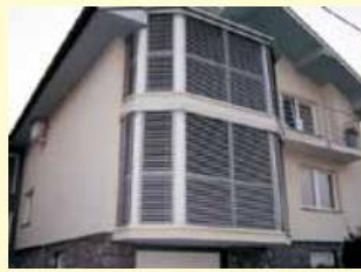
Zunanje alu žaluzije