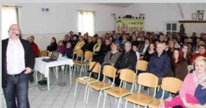
... prikaz, kako pristopiti k puncu.