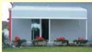
Tenda z nogami