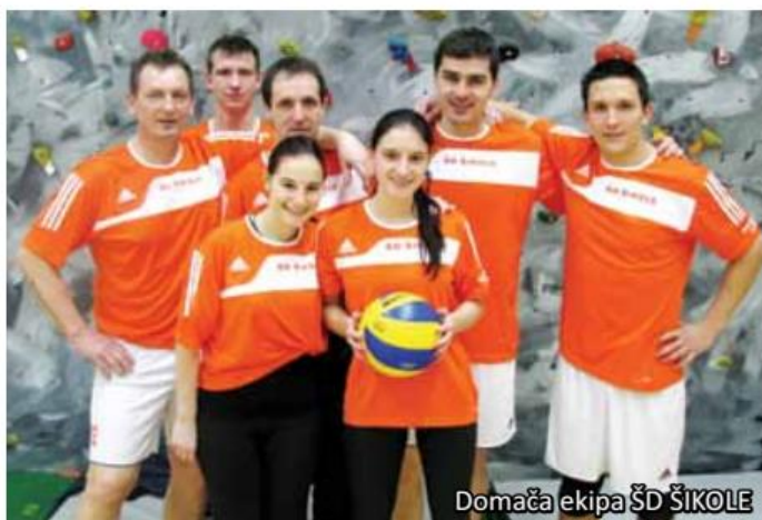
Domača ekipa ŠD ŠIKOLE