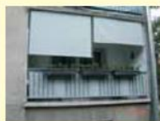
Roloji za balkone