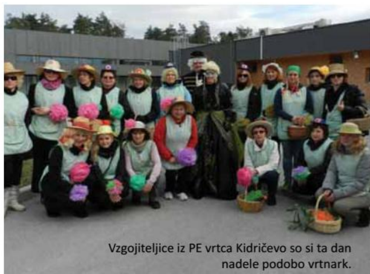
Vzgojiteljice iz PE vrtca Kidričevo so si ta dan nadele podobo vrtnark.