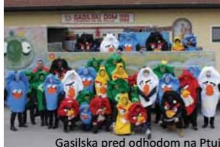
Gasilska pred odhodom na Ptuj