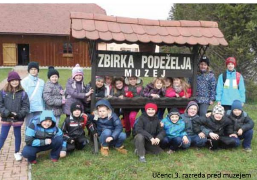
Učenci 3. razreda pred muzejem