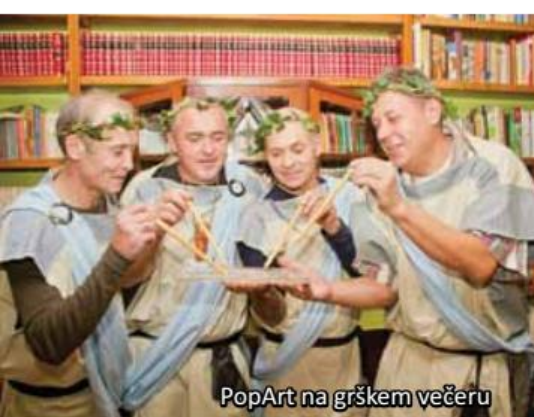
PopArt na grškem večeru