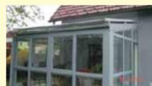
Tenda za zimske vrtove

Jasna poslovna vizija je ponuditi dobro kvaliteto po konkurenčnih cenah, velika mera znanja, poguma in prepričanja v lastne moči. Odlikuje nas hitra odzivnost, točnost dobave in dobri plačilni pogoji. Smo v stalnem koraku s časom, saj veliko vlagamo v nova znanja.