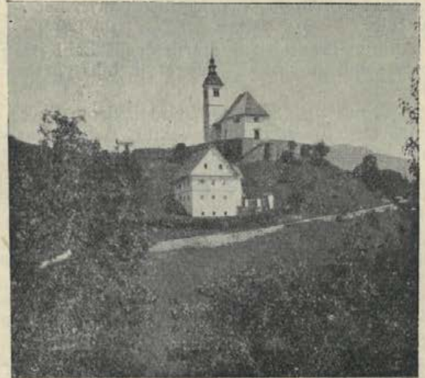
Cerkvica vrh goré, cerkvica bela! Vsak dan pozdravlja te duša vesela.