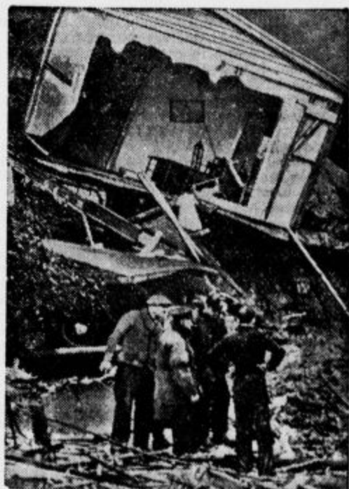
Prva slika o povodni katastrofi v Hollywoodu: Leseno vilo pri Los Angelesu je voda odnesla in jo vrgla ob breg. Vsi njeni stanovalci so utonili.

Po bitki pri Waterlooju je angleški vojskovodja Wellington to zaplenjeno Napoleonovo sabljo daroval lordu Angleseyju, ki jo je poklonil svojemu polkovniku Fraserju. V teku let je potem sablja prišla v druge roke, dokler je ni sedaj polkovnikova potomka kupila, da jo podari egiptčanskemu kralju. Tako bo sablja nekdanjega mameluka skoraj čez 500 let zopet vrnjena deželi, odkoder je prišla v Evropo.