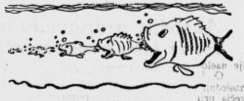
Takole je življenje!

Po svetovni vojni je bila 21. oktobra 1918 ustanovljena republika nemške Avstrije. Tudi njen razvoj do 13. marca 1938, ko je postala dežela nemške države in je s tem kot samostojna država prenehala, je znana.