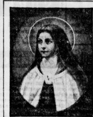
Moje največje veselje v nebesih bo v tem, da bom sipala na zemljo rože milosti (Besede svete Terezike malo pred njeno smrtjo)

Kakor biser, kakor najsvetlejša zvezda na nebesnem svodu — tako se blesti njeno ime v katoški cerkvi. Tisoce ljudi je v težavah in bridkosti okusilo izredno pomoč svete Terezije, ki se je čisto pokazala na čudežen način. Tudi sv. oče papež Pij XI. pripisuje svoje ozdravljenje od težke bolezni priprošni svete Terezije. Nič čudnega, če po vseh krajih iščejo ljudje v goreči molitvi pred kipom te svetnice tolažbo in rešitev.