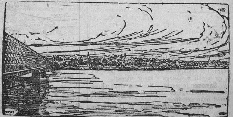
Panorama von Warschau

V zadnji številki že smo prinesli poročilo, da so z nami zvezane nemške čete zavzele rusko-poljsko prestolico Varšavo. To zavzetje je za celo vojno velevažno. Prinašamo sliko Varšave; v levem kotu je videti veliki železni most čez Vislo.