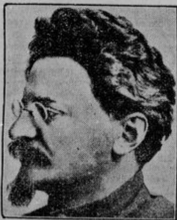
Leon Trocki, ki se baje pogaja za povratek v Rusijo. Stalin menda ni njegovemu povratku nasproten, toda vprašanje je, ako pojde Trocki v past, iz katere ne bo več izhoda.