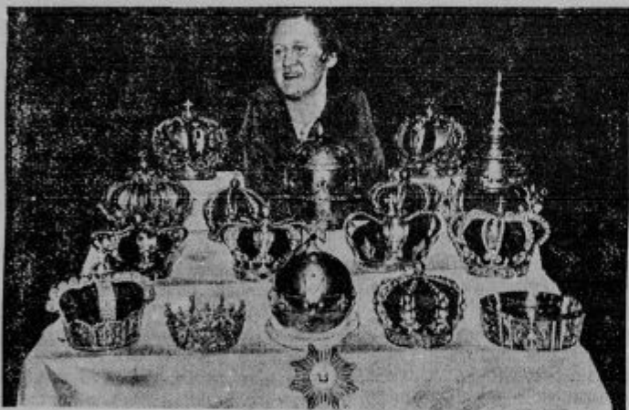
Na razstavi v Chicagu so razstavili tudi zbirko kron, ki so jo sestavljali 16 let. On jeve proti desni v prvi vrsti: kroni Viljema, nemškega cesarja in francoske cesarice Josephine; potem angleško jabolko in japonska zvezda; krone Norvegije, Švedije in Lombardije. V drugi vrsti: krone Portugalske, Italije, Anglije in Španije. V tretji vrsti: krone Napoleona, Holandske, papeža Leona, Danske in Siamu. Čisto zadaj na levi krona ruskih carjev in desno avstrijska cesarska krona. Skupno vrednosti teh kron cenijo 6 milijard.