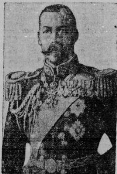
Angleški kraj Juri V. je včeraj ob 15 s svojim govorom odprl pred 2000 delegati svetovno gospodarsko konferenco.

je ta zob, če ga takoj ne zalijemo. Ostanek jedi se je zajedel med zobe, ustvarja se mlečna kislina in razkraja zobno sklenino. Posledica tega je majhna luknjica. Dnevna nega s Chlorodont zobno pasto štiti zobe pred prezgodnjim razpadanjem, ohranja je zdrave in dela srajne bele. Tuba Din. 8.-, velika tuba Din. 13.-.