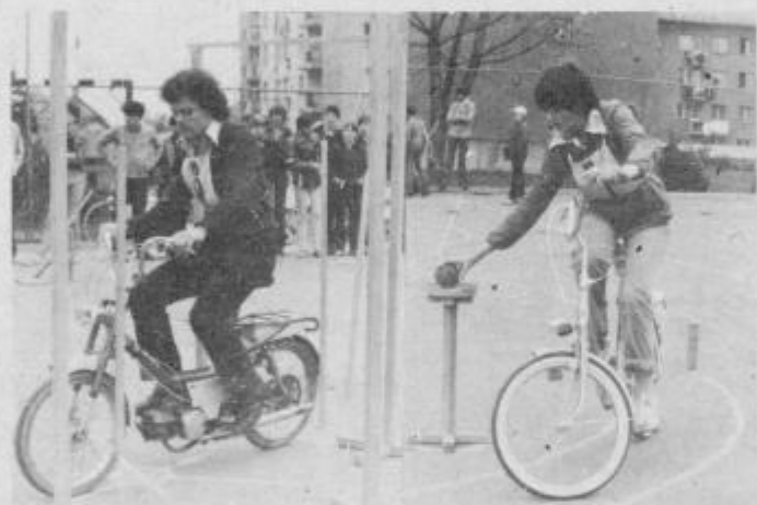
Na tekmovanjih Kaj več o prometu mladi iz leta v leto kažejo večjo mero znanja in spretnosti.

uspešno izvedla akcijo „pešec v prometu“. Še posebej so se izkazali pionirji—prometniki iz ptujskih osnovnih šol, ki so skrbno in previdno pomagali svojim vrstni-