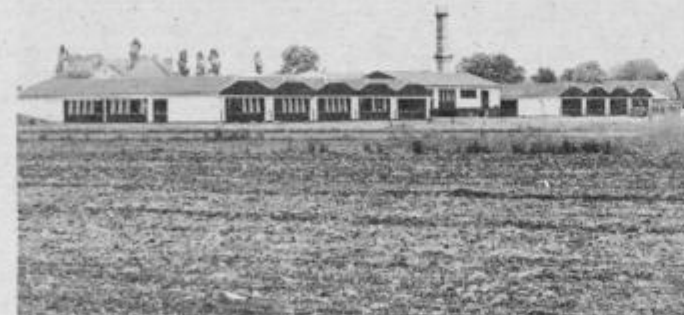
Ponosni so na novo šolo

Razmeroma uspešnih je tudi vseh 11 delegacij za delegiranje delegatov v skupščine občinskih samoupravnih interesnih skupnosti družbenih in drugih dejavnosti kakor tudi temeljna delegacija za zbor krajevne skupnosti občinske skupščine.