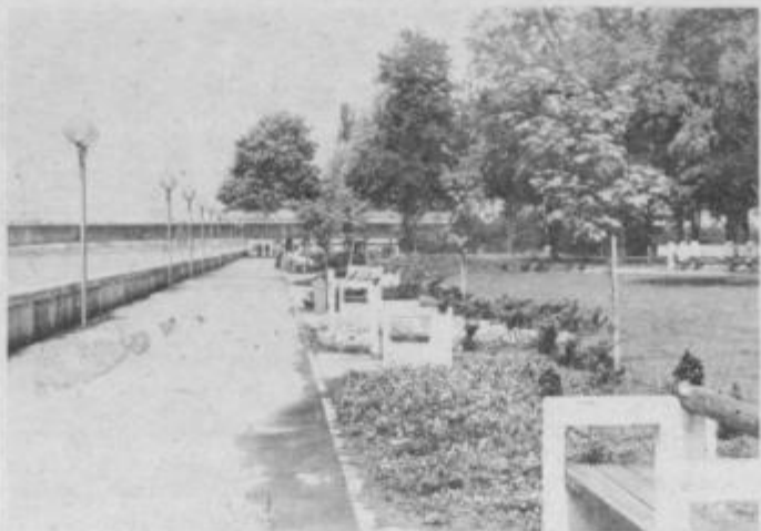
Park ob Dravi — priljubljena in urejena točka Ptuj