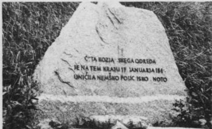
Spominsko obeležje na Plateh v naselju Jelovice. Kaže, da bo napis treba obnoviti.

Konferenca se vsem aktivnim udeležencem pohoda v Slovenskogoriškem Krambergerjevem odredu javno zahvaljuje za njihovo udeležbo in vzorno vedenje na pohodu. F. B.