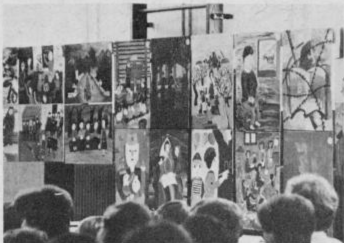
Pionirji likovniki so s svojimi likovnimi deli prav tako prikazali šolstvo med NOB