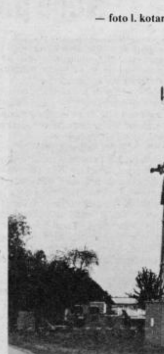
Nova trafo postaja v Bukovcih

Zelo uspešno pa smo zastavili delo pri izgradnji komunalnih in drugih objektov skupnega pomena, za kar so zaslužni skoraj vsi krajan, saj ni bilo akcije, ki ob veliki požrtvovalnosti in samoodpovedovanju ne bi uspela. Tako so v naši krajevni skupnosti sedaj asfaltirane skoraj vse krajevne ceste v dolžini 23.323 metrov, od teh pa jih je polovica tudi pod asfalt betonom. Javni vodovod je že v vseh obdrevskih vaseh, uspešno smo sodelovali z elektrogospodarstvom pri izgradnji novih transformatorskih postaj, zgrajenih je bilo nekaj avtobusnih postajališč, urejeno pokopališče ter