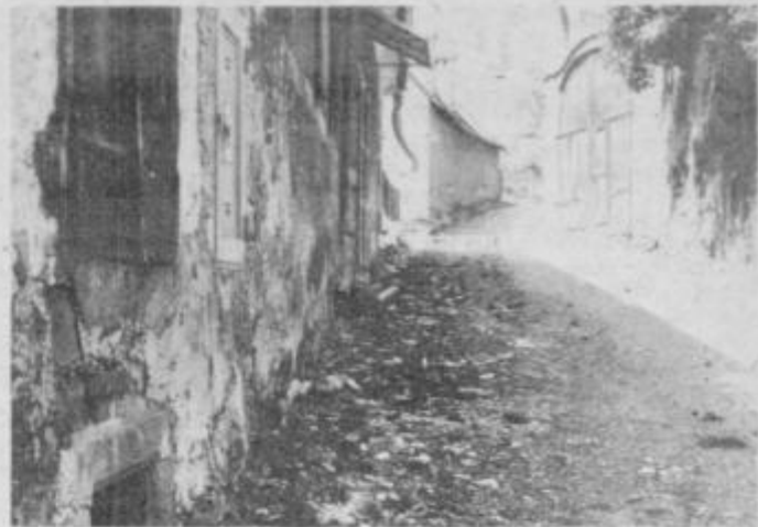
Pravo nasprotje pa je pot na grad