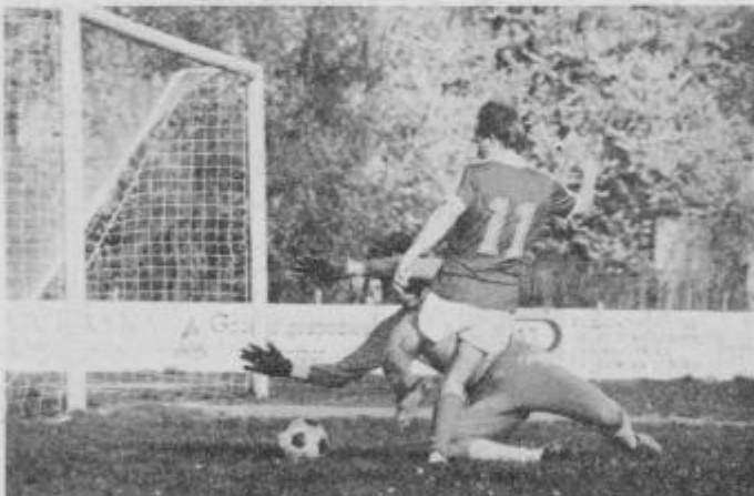
Krajnc (11), izredno prodoren napadalec Ptuja