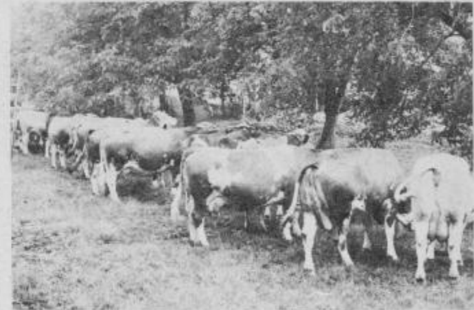
Dobra mlekarica pomeni za kmetijo precejšen dohodek

Kombinirana govedorejska proizvodnja je na našem območju že precej dobro vpeljana. Imamo kmetije, ki proizvedejo letno že po 100 tisoč litrov mleka. Po sedanjih cenah pomeni ta količina letni dohodek od 90 do 120 starih milijonov. Razen tega take kmetije ustvarjajo tudi dohodek od plemenske živine, oziroma od prodaje telet. Tako lahko usmerjena kmetija doseže visok letni prihodek, tako da z odbitkom