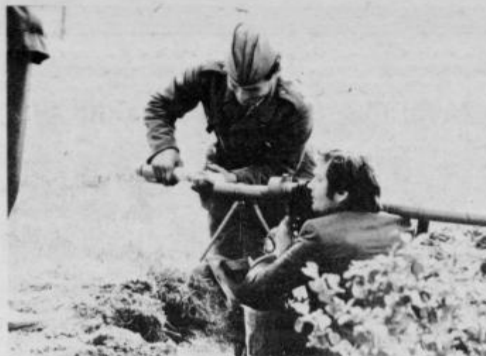
Prilava na strel