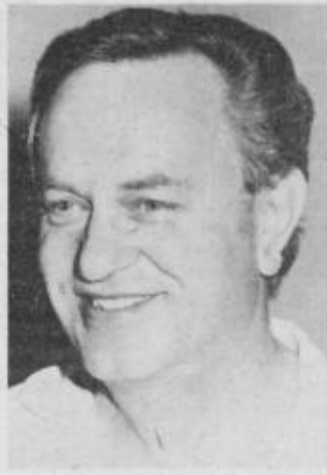
MG foto: Ciani Marjan Štolfa

Gre za življenjsko izredno pomembna vprašanja, ki terjajo veliko konkretnosti in toliko manj posploševanja. Ne moremo pa jih reševati brez potrebne angažiranosti.