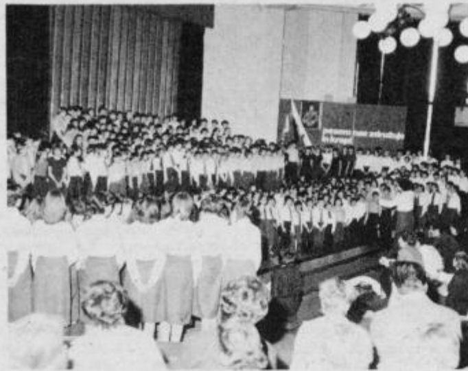
Skupni nastop mladih pevcev na reviji.

Vsem, ki so nastopili na reviji veljajo čestitke za njihov prispevek k letošnji reviji z željo, da svoje kulturno poslanstvo nadaljujejo, saj pesem nas resnično druži in krepi.