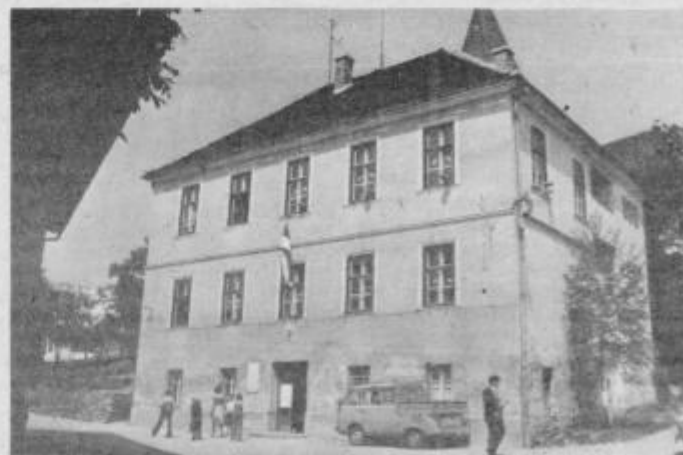
Nad sto let stara osnovna šola na Tinju čaka svojega naslednika.

jih je postavila posebna komisija, ki je že pred prvim samoprispevkom obiskala vse osnovne šole v občini. Predsvem povečani stroški gradnje in obnova osnovnih šol so osnovni vzrok, da tudi v tretjem samoprispevku osnovna šola na Tinju ni prišla na vrsto, in da bo zato potrebno sedanji