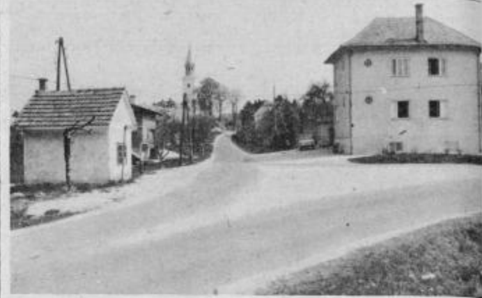
Urejene komunikacije in dom kulture so ponos središča KS Črešnjevec.