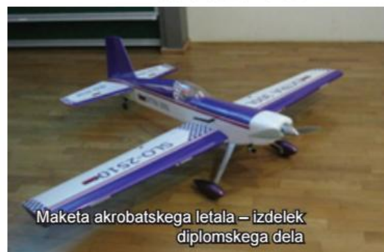
Maketa akrobatskega letala – izdelek diplomskega dela