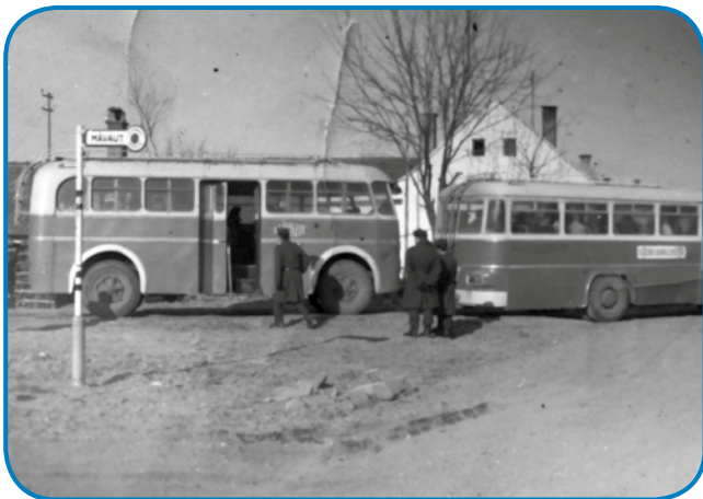
Takšen bus pa prikolica sta gnauksvejta vozila lüstvo na delo

»Ka ti povejm? Petdesetšestoga leta sem dja osem lejt star bijo, depa vse se dobro spaunim. Töj, kak je zdaj gasilski daum, tam so pufajkašdje (UDBA) stali pa v luft so strejlali, tak ka je vse trzarilo. Dja sem doma austo, najbola vejn zato, ka sem še mali bijo. Mena je tü dobro, zadovolen sem s tejm, ka mam. Dja trno