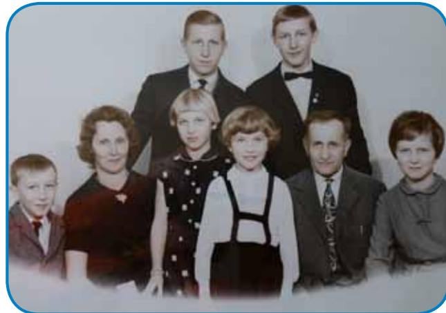
Ledinana (Šömenek) družina v Sakalavci, mati, oče pa šest mlajšov

- Vi ste nikan nej odišli, vam je dobro bilau doma v Sakalovci?