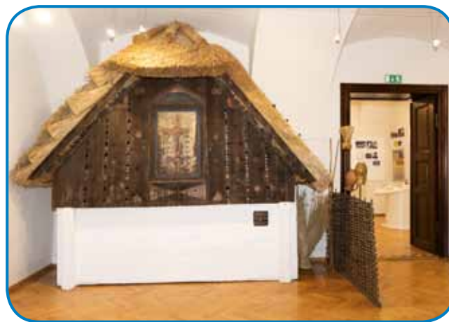
Svisli s poslikanin križon

vali po tom, kak so se lidge, pa tüdi živali in rastline, čütli. Če so v Gornjih Slavečih okraug sunca vidli obrauč, je tau znamenüvalo, ka de šau dež, če pa je bilou sunce z oblakom pa leko ka de ploja. Mejsec z vencon ali obraučom