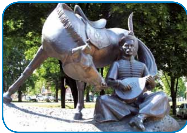
Eričnoma goslarí ino zgodovinarí Sebestyén Tinódi Lantosí - šteri je mrau v Sárvári - je tó dosta pomago Tamás Nádasdy

V srejdnjom vöki so bile ženske dosta menje vrejdné kak moški, šterim so mogle slüžití. V 16. stoletji so je v pismaj eške zvali »ženska stvarina« (»asszonyállat«), depa v 17. stoletji že »ženski človek« (»asszonyember«). Vnauigi velikaši so tistoga ipa donk čistili svoje žené, zavüpali so jim svoje brige ino eške njine