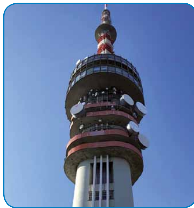
Televizijski törem na leto gorpoiške 80 gezero turistov

Pomalek sva gorprišla, ka se nama - zavolo delovnoga dneva - nej trbej stiskavati med turistami. Poglednila sva si vse drauvne pa tüčne majmu-