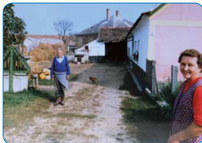
DOJAN JE BIU PRI MENA stran 8