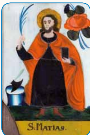
PERŪN TE FČESNO stran 4