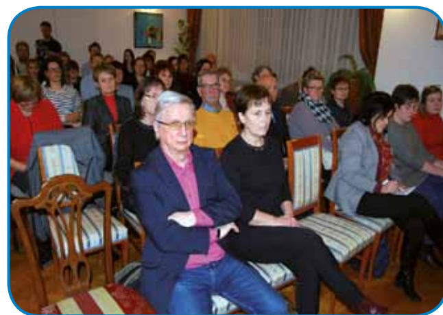
Sejno sobo Generalnega konzulata so napolnili predstavniki šolskega, kulturnega in medijskega področja

V načrtu so izdaje za kitajski, srbski, poljski, češki, bolgarski in makedonski jezik, medtem ko so prvega - madžarsko-slovenskega - pripravili sodelavci oddelka za slovenski jezik, ki