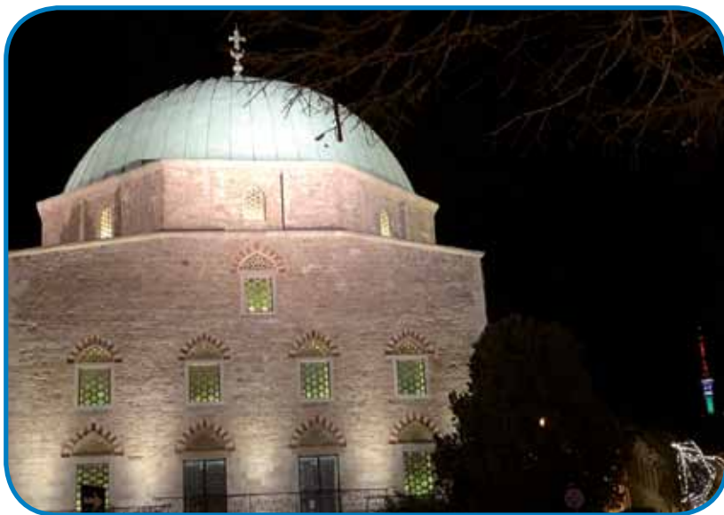
Džamija v centri Pécsa - oprvim Bertalanova, sledik muslimanska, zdaj Marijina cerkev

Če rejsan se največ lüdi pripela z autonom ali busom, ništerni turisti pejški tö gor k törmi pridejo. Müva s padašom sva se z liftom zdignila na 80 mejterov visiko, gde sva oprvim napravila eden veuki kraug na oprejtój terasi. Vrejmen je čisto bilau, daleč se je vidlo v bregé Mecseka. Baja je samo ta bila, ka je sunce drejkt s strani Pécsa v auči sijalo, zatok se je z varaša skoro nika nej vidlo. Osem mejterov niže sva si prištólala eden dober kafej v kavarni, gde leko lačen pautnik za dobre penenze obed tö gej. Če rejsan sva pri ednom radiatoru sejlda, je naja najbolje zimsko sunce prejk glažojnatoga okna segrejvalo.