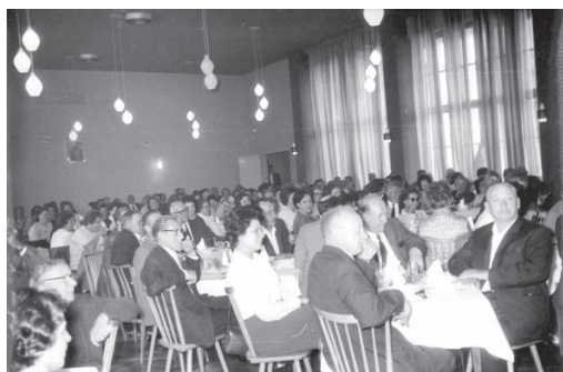
Notranjost kavarne (hrani Goriški muzej, etnografski oddelek, št. 29516).

Po odobritvi investicijskega programa s strani sveta za gostinstvo in turizem OLO Gorica se je gradnja nadaljevala in v letu dni uspešno zaključila. Na dan slavnostne otvoritve, 7. oktobra 1959, je tedanji predsednik skupščine občine Nova Gorica Ludvik Gabrijelčič (1921–1985) poudaril, da gre za prvi gostinsko turistični objekt v novem delu mesta, in izpostavil njegovo odločilno vlogo pri razvoju domačega turizma 4 (Nova kavar- na 1959: 1).