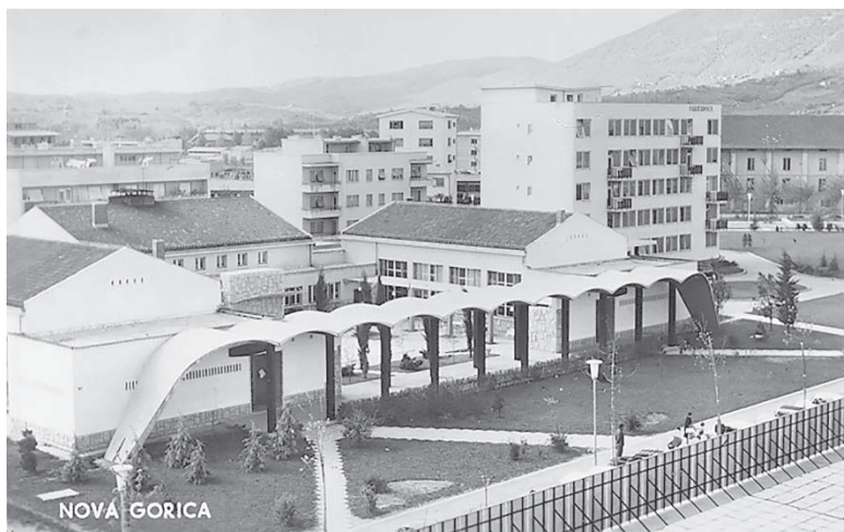
Kavarna in restavracija z novim poslopjem hotela Park.