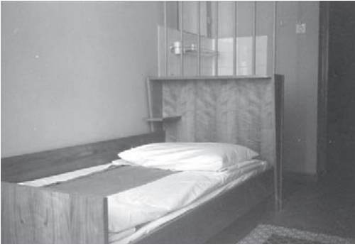
Enoposteljna hotelska soba z umivalnikom v hotelu Park.

in bolj zahtevne skupine turistov (Mir 1970: 6). V naslednjih desetletjih se je zvrstila vrsta obnov, ki so hotel postopoma vedno bolj oddaljevale od njegove prvotne izvorne oblike. Njegova današnja podoba je namreč le bleda sled slavne preteklosti in družabno-zabaviščne funkcije, ki jo je imel v petdesetih in šestdesetih letih za domačine.