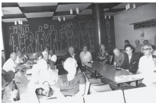
Notranjost restavracije (domnevno t. i. »posebne sobe« za zaključene skupine ob točilnici/bifeju).