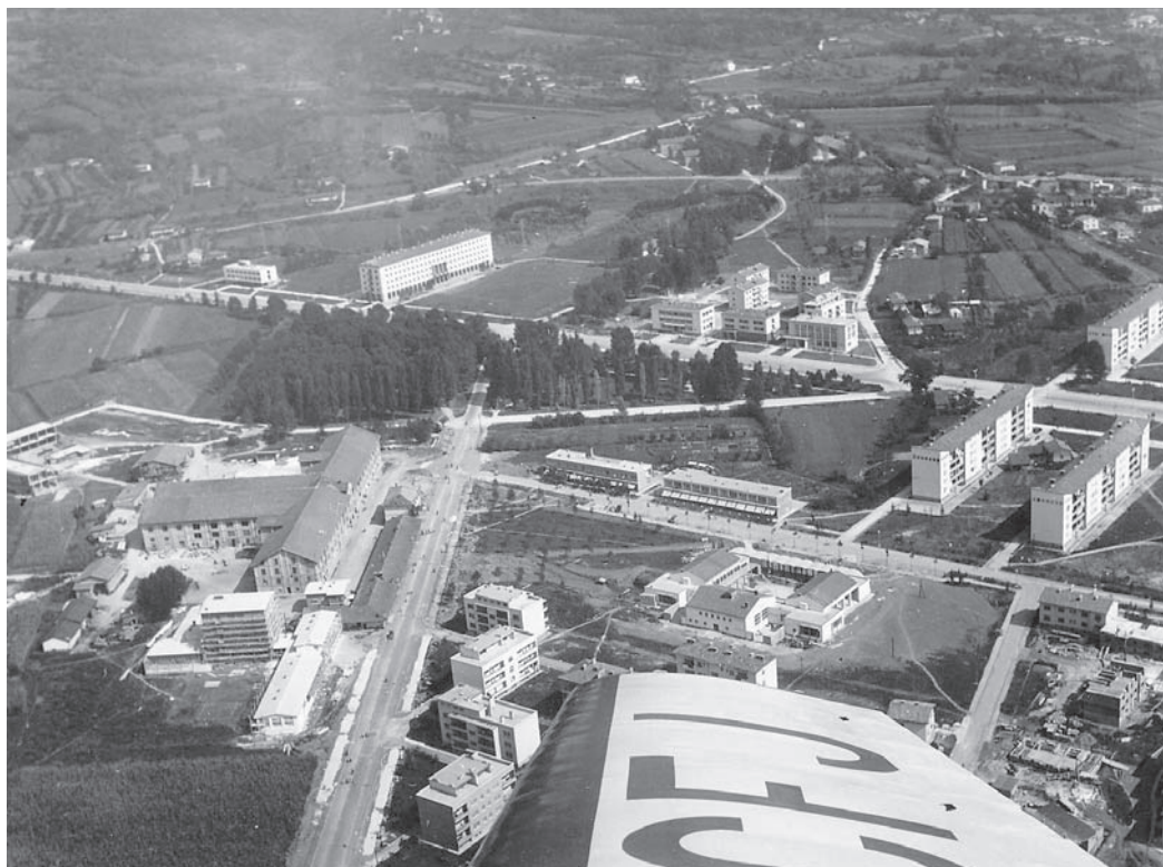
Letalski posnetek Nove Gorice leta 1960 z dokončano kavarno in restavracijo na cesti št. 5 (Delpinovi ulici) (hrani Goriški muzej, zgodovinski oddelek, št. 12021).