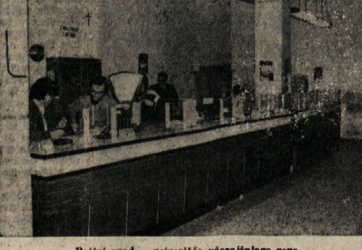
Postni urad - prizorišće večerajšnjega ropa