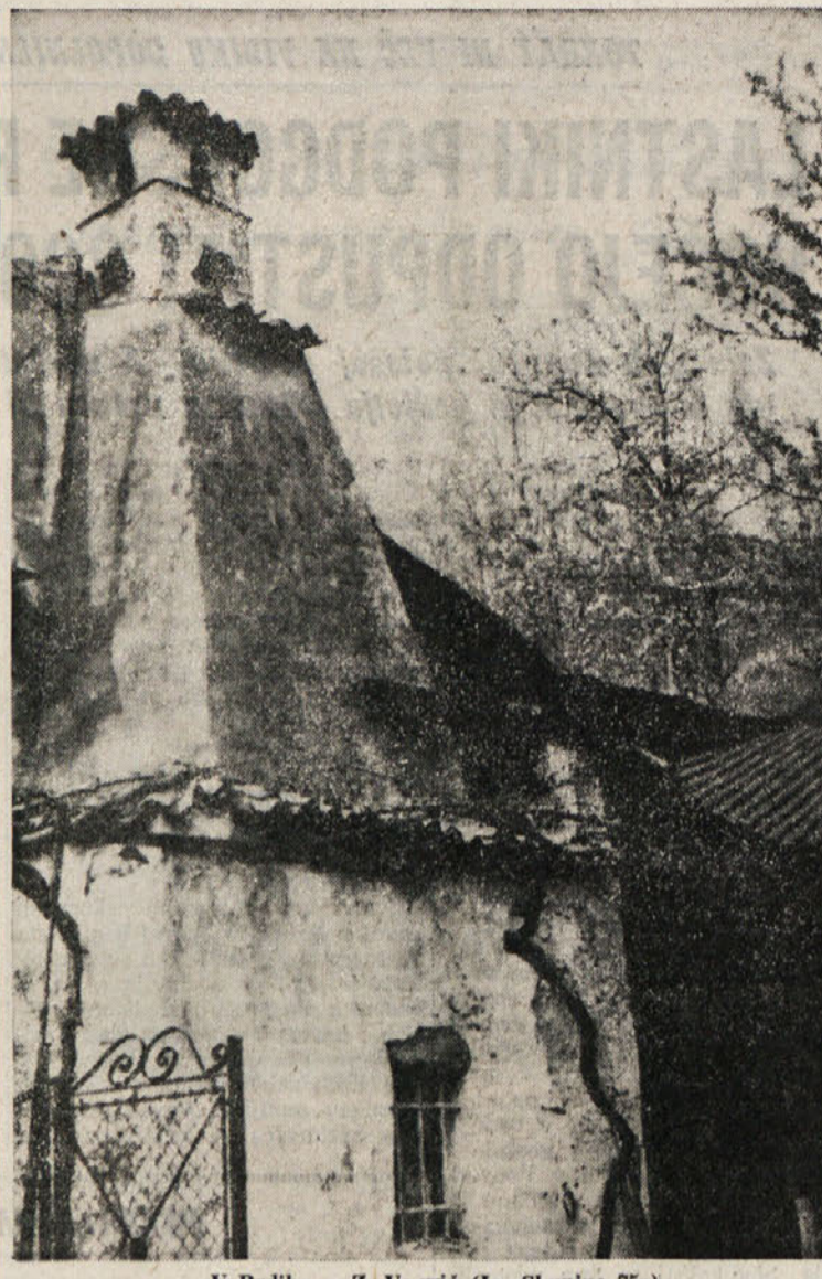
v Bredih — Z. Vogrič (iz «Skupine 75»)