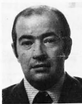
Milan Vremec Vzhodni Kras (števil. 2)