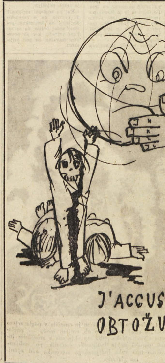
(Narišal R. Hlavaty)