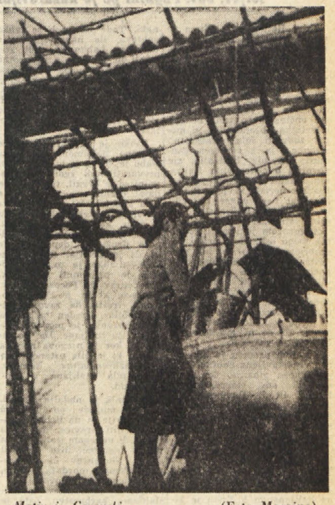
Motiv iz Cerovelj

Dejstvo pa je, da prihaja v našo vas kljub vsemu sorazmerno le malo izletnikov. Vemo, da jih je težko privabiti, saj so se v zadnjih letih že močno uveljavile druge turistične postojanke na našem podeželju, predvsem Bazonica, Repentabor itd. Toda to ne pomeni, da je treba vreti puško v koruzo. Naša vas se n. pr. ponaša, da ima v vsej zgornji okolici najvišji zvonik, ki je viden od Nabrežine na eni in z Opčin na drugi strani. Z malenkostnimi stroški bi se dalo napraviti dvakratnik ali pa vrh zvonika opremiti z nekaj cevni neonske razsvetljave, pa bi ga videli ponoči daleč naokoli.