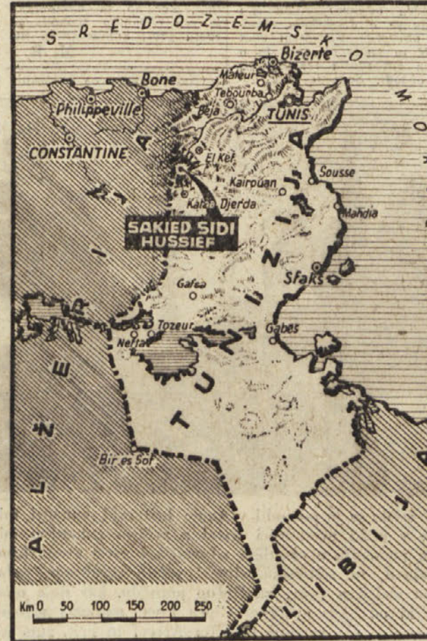
(Nadaljevanje na 8. strani)