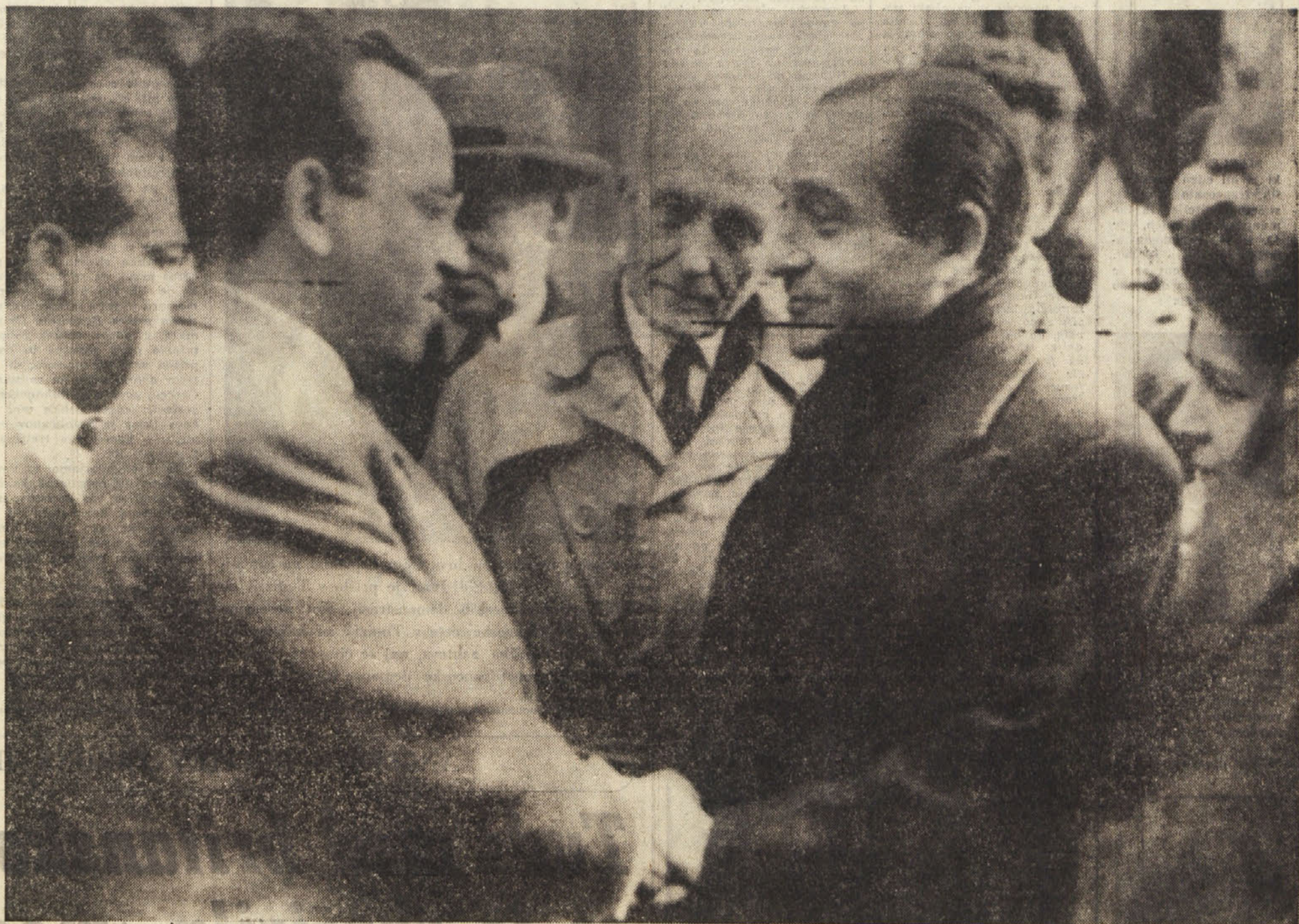
Nikakor ni res, da bi bili vsi Francozi za kolonialistično politiko, ki jo vodi Gaillardova vlada v Afriki. Na sliki vidimo bivšega vladnega predsednika Mendès-Francea, ki se je prišel posloviti na letališče od tuniskega veleposlanika Masudija, katerega je predsednik Burgiba odklical iz protesta proti divjaški napadu na tuniško vas pred osmimi dnevi. Enako so iz solidarnosti s Tunizijo storili številni francoski javni delavci, pisatelji in umetniki.