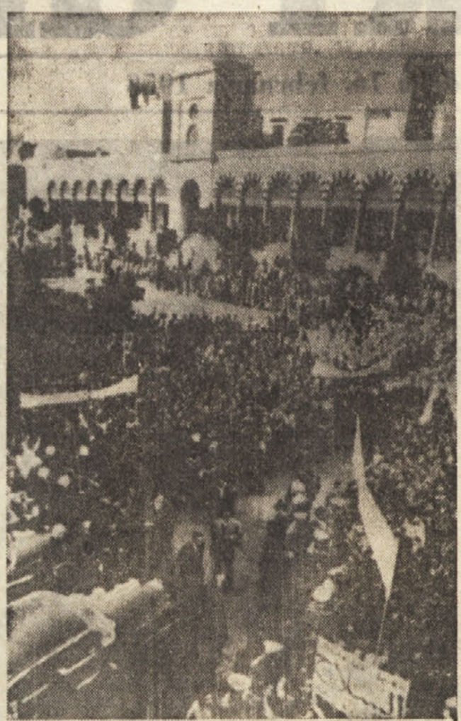
V zvezi s francoskim brutalnim napadom na tunizijsko naselje Sakiet-Sidi-Jusef je prišlo v Tuniziji do velikih protifrancoskih demonstracij...