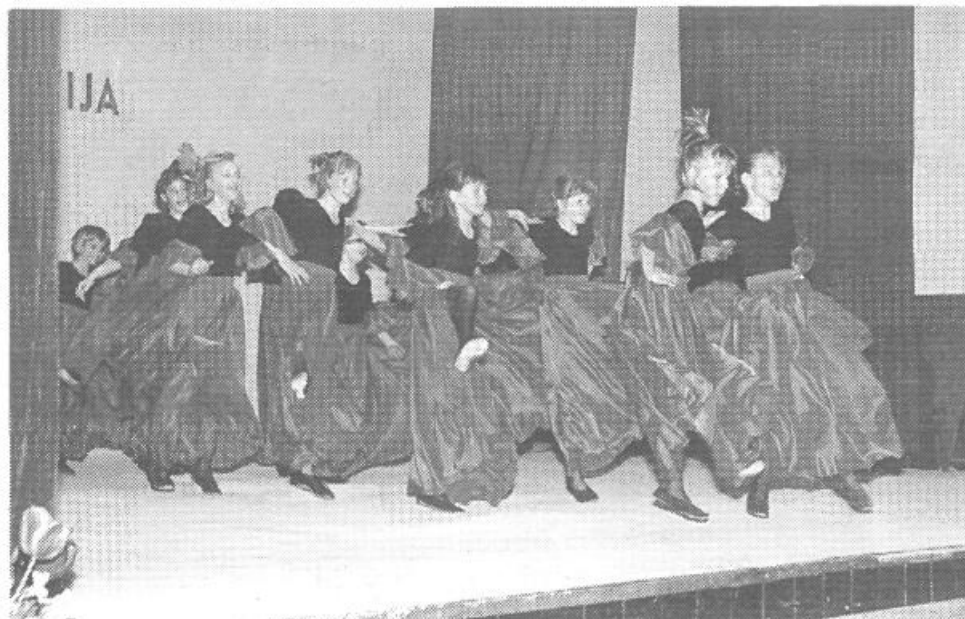
Plesna skupina Ekstrem iz Dobrove se je predstavila z značilnim francoskim kan. kanom.