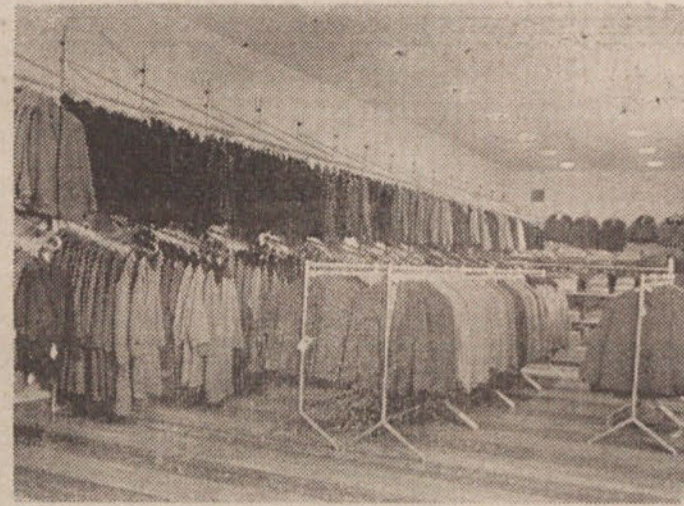
Nova prodajalna Modnih oblačil

Nenehno je delovni kolektiv iskal možnosti za razširitev podjetja. Z adaptiranjem novih prostorov je podjetje skušalo reševati problem