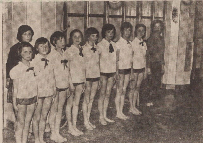
Tekmovalna vrsta pionirk na orodju — veliki no TVD »Partizana« Bežigrad

»Partizana« Narodni dom organizirali tudi poletni tabor ob morju in bi člani ostali skupaj vse leto, kar bi se nedvomno poznalo tudi ob raznih tekmovanjih. Toda za take želje ni denarja. Vseeno pa se je stanje znatno izboljšalo, odkar je bila ustanovljena Občinska zveza za telesno vzgojo. V bežigradskem Partizanu zato upravičeno upajo, da se jim bodo njihove želje prej ali slej izpolnile.