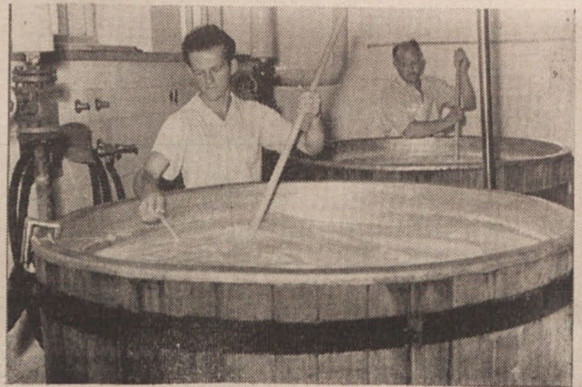
Predelava mleka v Velikih Laščah

Izmed težav v poslovanju podjetja pa bi omenili le to, da bo najbrž kmalu nastopilo vprašanje, kam plasirati mlečne proizvode. Velika količina mleka, ki ga dobivamo od posestev, je na eni strani koristna za nemoteno preskrbo, po drugi strani pa nas zaradi visoke odkupne cene postavlja v neenak položaj z drugimi mlekarjami, ki za svoje mlečne proizvode odkupujejo mleko znatno ceneje.