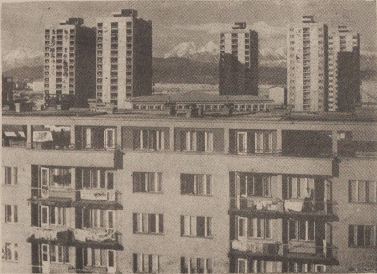
Pred tremi leti je bilo tu še polje — zdaj pa dobiva ta del naše občine pravečo velemestno podobo