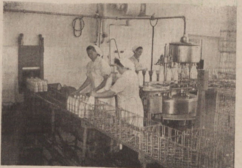
Čolnarnica v centralnem obratu v Ljubljani

O b r a t i: Nova vas, Velike Lašče, Stična, Prevoje, Brežice in Bled