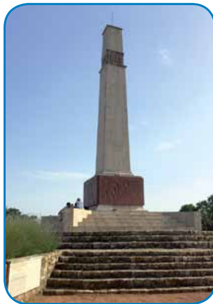
Obelisk na srejudi narodnoga spominskoga mesta v Pákozdi spomina na bitko v septembri 1848

Naš ciu je bilau jezero Ve-lencei , štero je tretje naj-vekše jezero na Vogrskom. Ranč tak kak Balaton, je trnok prilübleno med li-