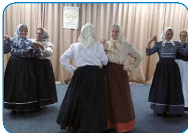
Folklorna skupina Društva porabski slovenski penzionistov

Dapa pri nas je tō nej vse samo dobro pa lejpo. Žalostno je, ka so naši člani starejši gratali, mlade slovenske penzioniste pa ne vleče več druženje kak pred desetimi lejti.