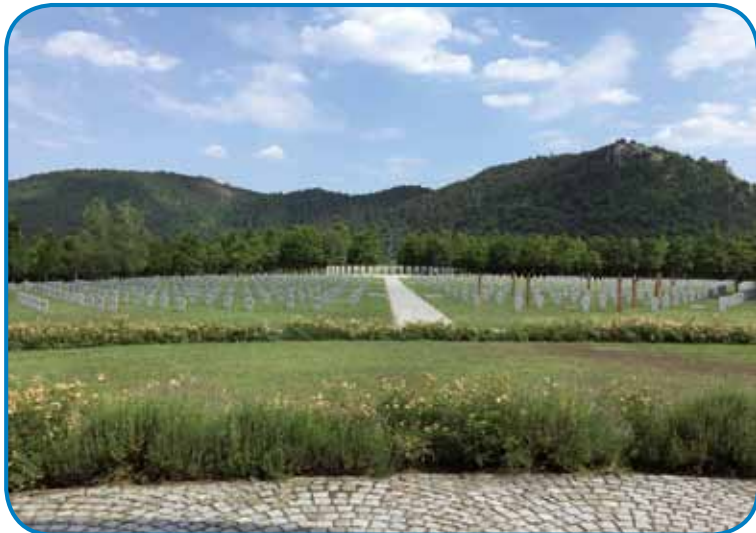
Veški tau v Budaörsi pokopani nemški in vogrski sodakov je spadno kauli Budimpešte - tejlá so ekshumérali na 1400 mejstaj na Madžarskom

V spominskem parki gnes nutpokažejo zgodovino madžarske sodačije od boj-ne za slobaudnost v lejtaj 1848/49 do gnes. Leko si