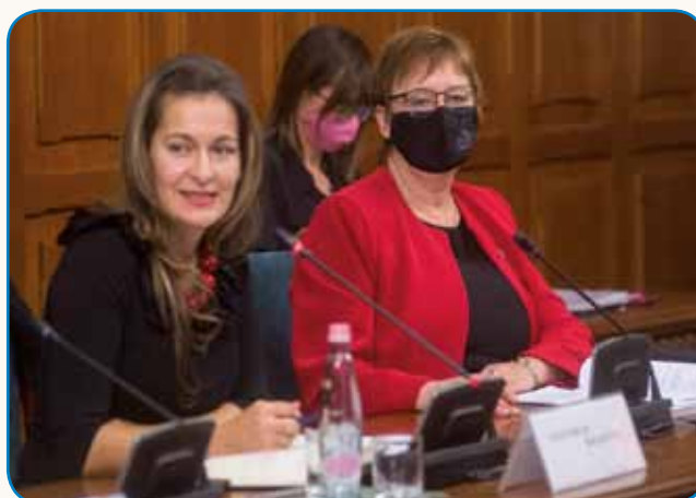
Poročilo podpredsednika vlade stran 7