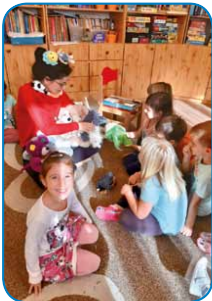
Pri mlajših učencih potrebuješ veliko domišljije, da jih motiviraš pri pouku jezika

Zaupam v otroke, želim verjeti, da smo učitelji danemu izzivu kos. Da bomo skupaj razumeli, koliko dobrega in vrednega je v okolju, v katerem odraščajo ti otroci. Da je dvojezičnost izjemna družbena kategorija, ki posamezniku omogoča večkulturni razvoj. S tako bogato kulturno dediščino, kot jo ima Porabje, s porabsčino, s toliko