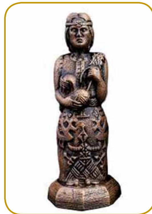
Tak gnešnji umetnik boginjo Mokoš vidi

se vej, od gda té svejt stodji. Mokoša aj bi boginja vode tö bila. Brez nje nega vode, nega vsega tistoga, ka voda človeki dava. Vejmo, že od inda so lidge po vodej kračišo paut od enoga kraja do drugoga iskali. V vodaj so si gesti najšli, nej malo gestija, ribe, rake, ftiče na vodej pa tak naprej pa tak tadale. Njivo delo je Mokoš napelavala, je z njim ravnala. Gvüšno, ka zavolo vsega, ka voda zna-