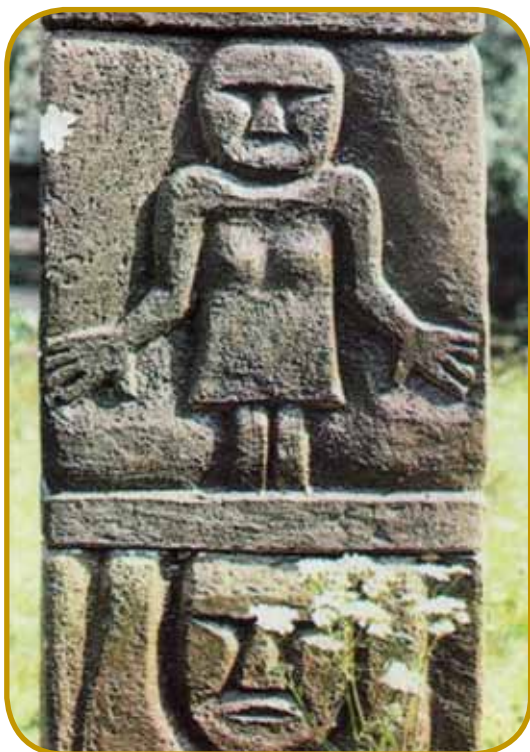
Mokoš je duge roke mejla. Z njimi je leko velko prdiva napravla

Živa pa Morana, življenje pa smrt, sta boginji, sterivi smo nazadnje spoznali. S tejm se vidi, ka je pri naši stari Slavaj emancipacija živela eške prva, kak si go je gnešnji svejt vözbrodo. Malo baukše povejdano, gda je emancipacija vse bole živeti začnila. Ranč pri tej dvej boginjaj bi si stoj leko brodo, kak sta trno visko bile postavljenivi. Tevi dvej, sterivi življenje začneta pa ga zgotovita.