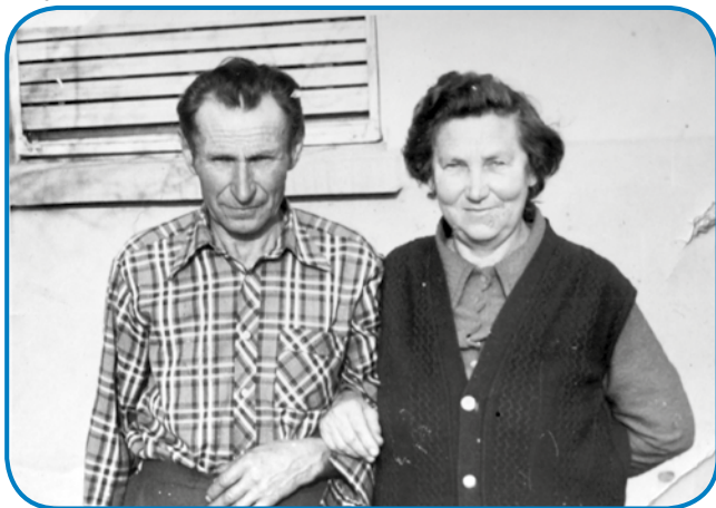
Mati pa oče

»Moj dejdek, od materé oča, je spoj čeden človek bejo. Depa on je v šaulo nej odo, nej vedo nej šteti pa nej pejsati, zato ka še mali bejo, gda so ma stariške mrlji. On je tō od tauga rama, od Djaustji bejo, kak sem se dja naraudila, zvau se je pa Kovač. On je nej bejo vōnavčeni, depa itak je znau vse, če kaj vesi trbelo tanaprajti, te so vsigdar njega zvali. Gda je cejli den po vesi odo, tašoga reda se je večkrat zgaudio, ka se je napijo, te je večkrat bešejtivo babo, depa do nas, do mlajšov (do vnukov) je vsigdar dober bejo. Po večeraj je nam taše pravljice gučo,