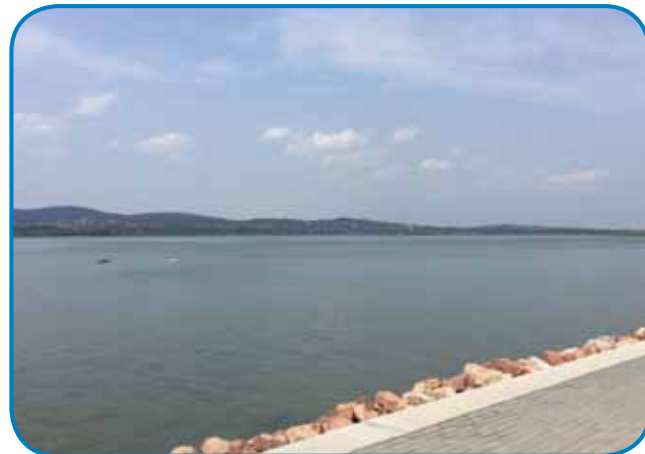
Jezero Velencei, gda se niške ne kaupá v njem

raš, smo na nemško-vogr-skom sodačkom cintori v Budaörsi nikoga nej najšli, šteri bi nam leko pomago tam najti ednoga spadnje-noga Gorenjesenčara.