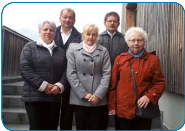
Z ljudskimi pevci z Gornjega Senika, skupino je vodila 20 lejt

od mlašečih lejt spejvala, so ške povedali na prireditvi v Žalci. Znamo, ka že 68 lejt spejvle v najstarejši porabski kulturni skupini, Mešanom pevskom zbori Avgusta Pavla, leta 2000 je ustanovila skupino Ljudski