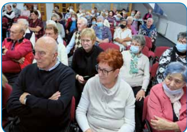
Svetili smo 25. oblejtnico stran 3

»NE MOREŠ POVEDATI, KAK JE LEP AU, GDA TELKO LIDI VKÜPER SPEJVA«