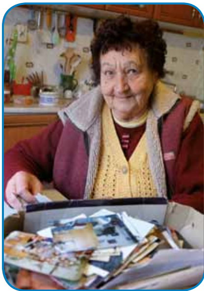
Djaustji Margit vsigdar rad pripovejda

- Tetica Margit, gnauk sem niše stare papire gleda pa tam sem vido, ka vaš dejdek so birauv bili v Andovci, dja sem tau dotejga mau spoj nej vedo, gučali bi mena malo od tauga?