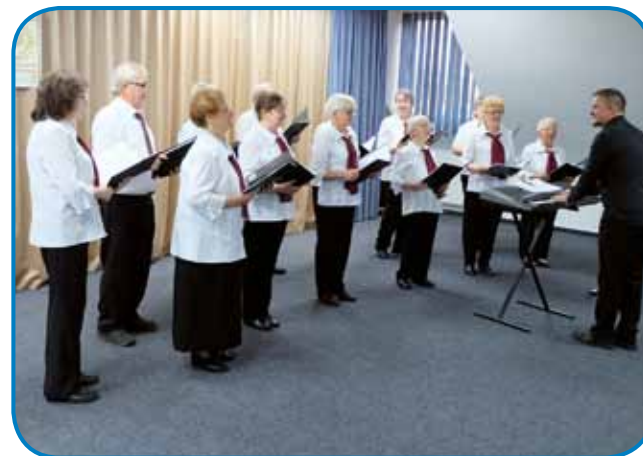
Pevska skupina Rozmarin je spejvala porabske ljudske pesmi