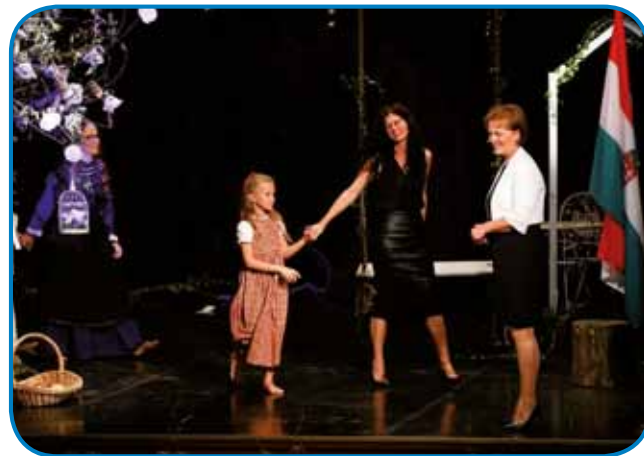
Na odru monoštrske gledališke dvorane z učenko in predsednico ZSM po uspešnem recitalu, ki ga je sestavila in režirala ob 30-letnici Zveze

Vemo, da imate tudi umetniško žilico. V Porabju ste kot scenaristka in režiserka pomagali pri pripravi številnih programov ob kulturnih in drugih podobnih prireditvah.