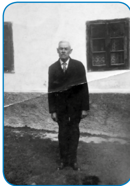
Dejdek, steri je birauv (žipán) bijo v Andovcaj

kami, stera je po pošti pošilo.« - Doma je tak velko srmastvo bilau, vej pa vse so odnesli