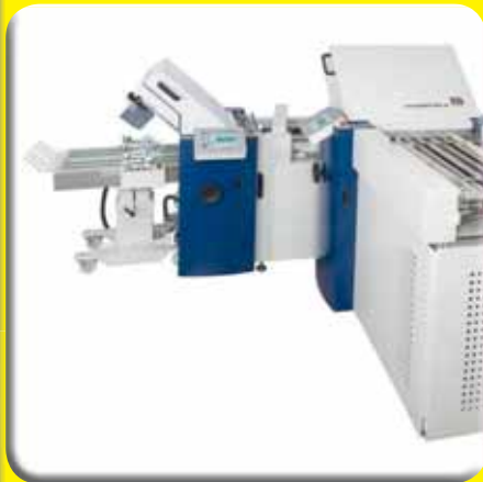
Sistem z dvojno izravnalno mizo.