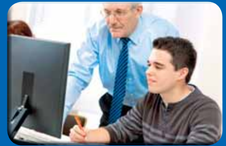
Delodajalci imajo možnost preizkusa mladih brezposelnih s povračilom stroškov.

Med vsemi navedbami smo zagotovo kakšno izpustili. Tudi udeleženci predavanja so željo po še več informacijah izkazali ob koncu predavanja z dodatnimi vprašanji. Tako kot v enem predavanju je tudi v enem prispevku težko nanizati vse bistvene smernice in možnosti v grafiki, zato vas vabimo k branju naše revije Grafičar in portala www.graficar.si tudi v prihodnje. Kot uredništvo se bomo še naprej trudili, da vam tovrstne in druge teme približamo čim bolj pravočasno v skladu z aktualnimi smernicami in v zadostnem obsegu. Spremljajte nas, se izobražujte z nami in soustvarjajte pravo, sodobno in profesionalno slovensko grafično okolje!