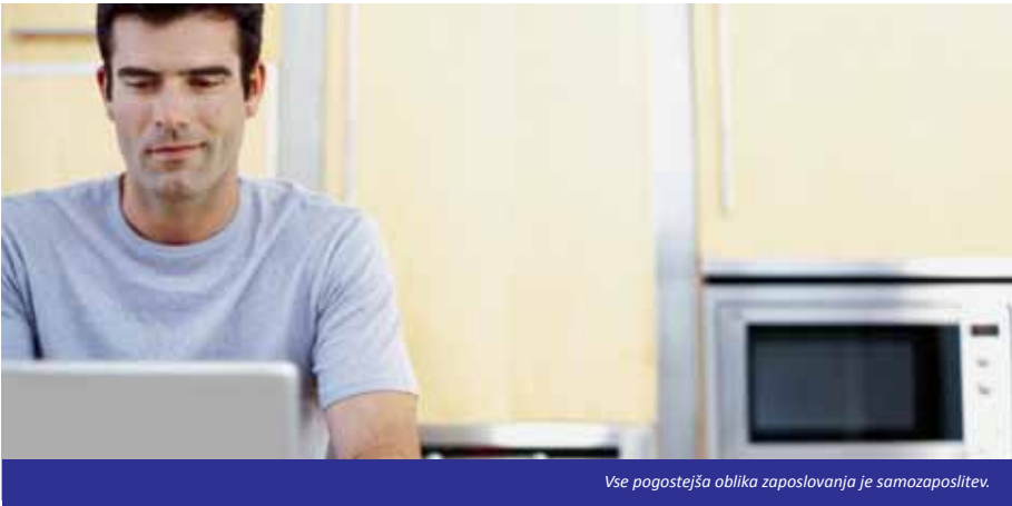
Vse pogostejša oblika zaposlovanja je samozaposlitev.

Za tiste, ki kakor koli razmišljajo o samostojni podjetniški poti, smo si pogledali poenastavljen postopek registracije podjetja, ki ga lahko izvedemo na vseh VEM-točkah ali spletnih portalih eVEM: