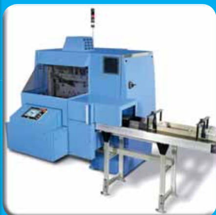
Prilagodljiv trireznik Granit.