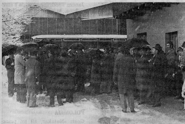
Ob prihodu v TOZD Mojstrana

Kaj v njem pogrešate, da bi se dalo izboljšati, da bi se uvedle še kakšne nove rubrike npr. Gospodinske nasvete?