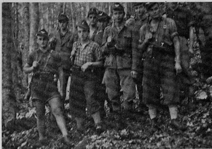
Na slikah del udarne čete Pokljuka, september 1943

imeli martinarski zidarji v tovarni, in so se tesno prilegale na obraz. Tehnika zbiranja orožja je bila taka, da smo se dva ali trije pripeljali s čolnom na mesto, kjer je bilo orožje. Potem smo se običajno nekoliko zravnsali, tako da je eden »slučajno« padel v vodo. Ta se je potem potopil in skušal poiskati puško. Najdene puške smo potem obesili na verigo in se počasi odpravili proti koncu grajskega kopališča. Tam je takrat župnišče imelo svojo čolnarno. In v to čolnarno pod pod, kjer je bila voda plitva, smo spravili najdeno orožje. Od tam smo ga zvečer ali ponoči prenesli drugam. Eno od skrivališč je bilo tudi v luknji, ki jo vidite v grajski skali.