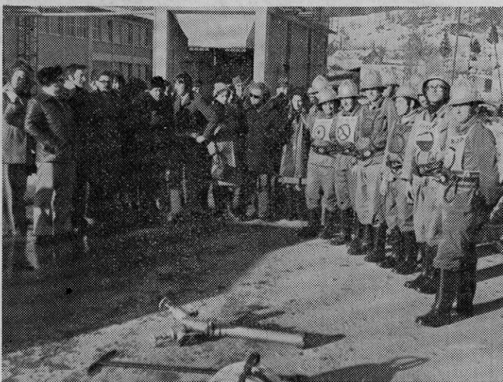
Udeleženci tečaja pri praktični gasilski vaji na Rečici

Zavedati se moramo, da tudi našim krajem in pribivalstvu širrom domovine take in podobne nesreče ne prizanašajo, zato naj bo dolžnost in cilj nas vseh državljanov, predvsem velja to za VSE zaposlene v TOZD, da pri kakršnikoli nesreči obvezno sodelujemo pri reševanju ljudi, živali in dobrin. Reševati in nuditi pomoč tistim, ki so jo potrebni, kot tudi samemu sebi, pa brez zato potrebnega znanja lahko samo večkrat škodujemo kot pa koristimo.