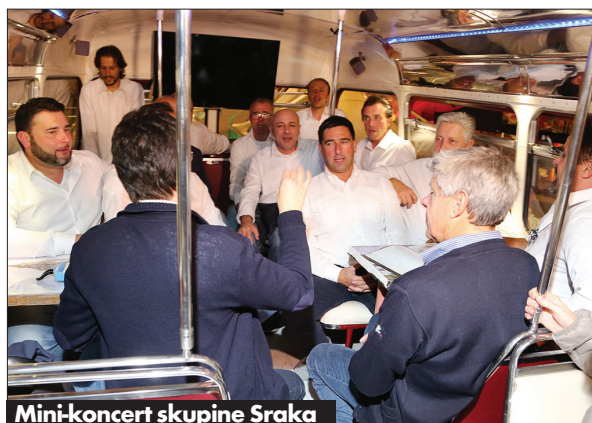
Mini-koncert skupine Sraka