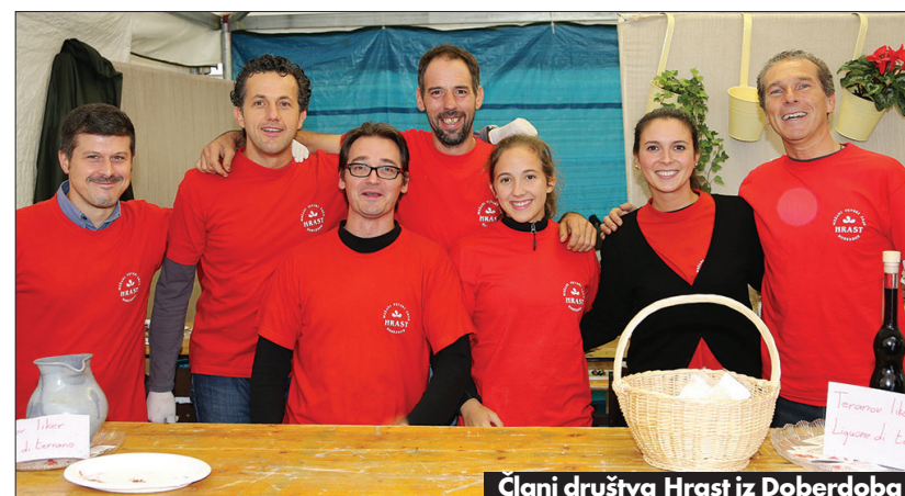
Člani društva Hrast iz Doberdoba