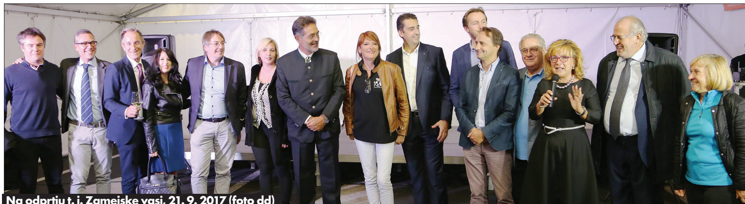
Na odprtju t. i. Zamejske vasi, 21. 9. 2017