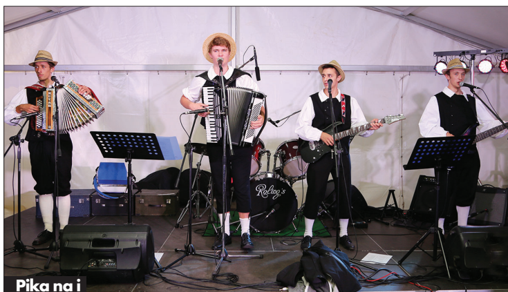
Pika na i