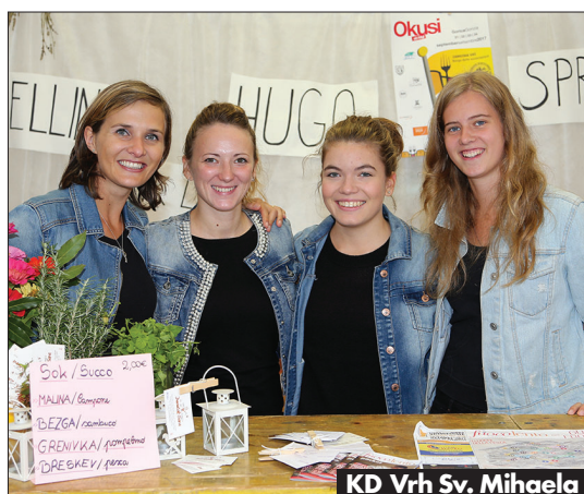
KD Vrh Sv. Mihaela