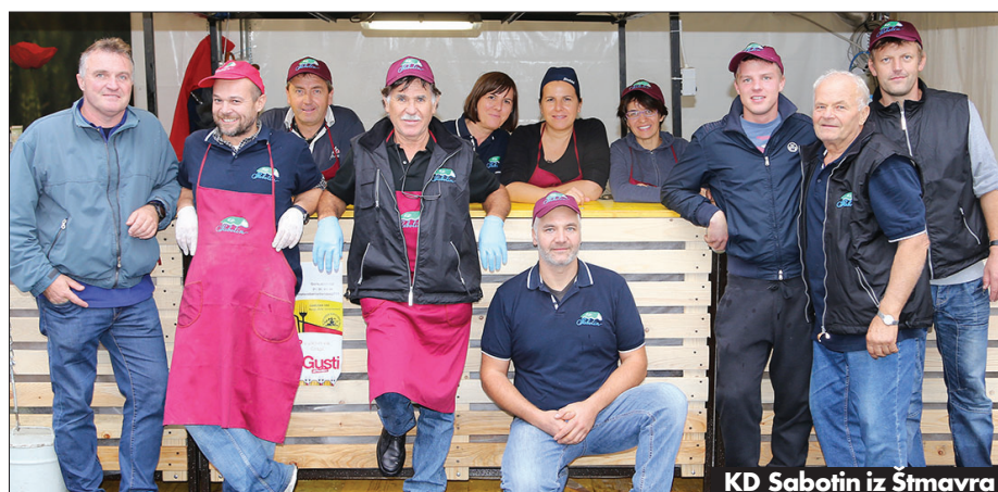
KD Sabotin iz Štmavra