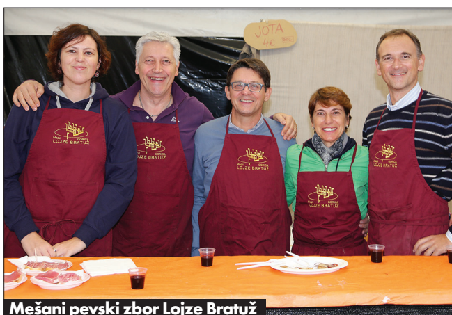
Mešani pevski zbor Lojze Bratuž