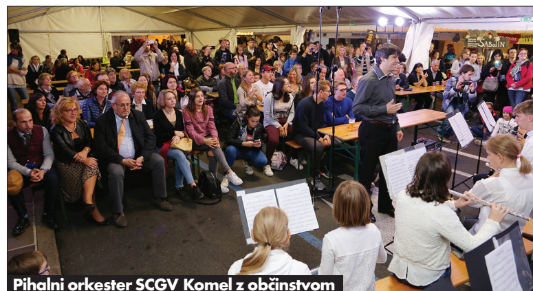
Pihalni orkester SCGV Komel z občinstvom