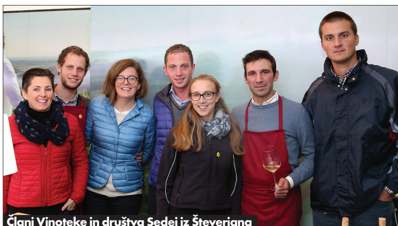
Člani Vinoteke in društva Sedej iz Števerjana