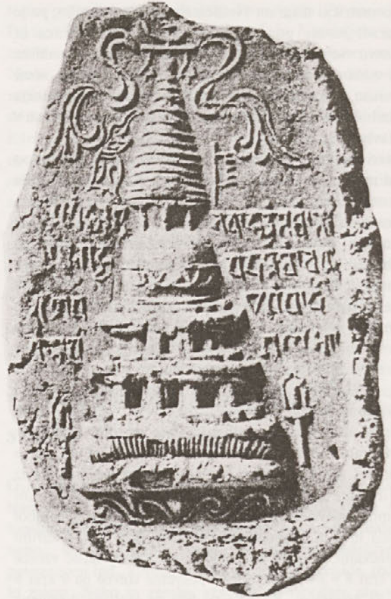
Glinasta votivna tablica z upodobitvijo stupe (Tibet)

Angkor Wat je zgrajen kot utrjena palača, obdana z zidom in širokim vodnim jarkom. Bila je kraljeva rezidenca in obenem svetišče, ki je predstavljalo Višnujeva nebesa, zato so na reliefih in v skulpturah poleg Višnuja upodobljena tudi vsa druga nebesna bitja. Kamboški vladar je sam veljal za inkarnacijo boga