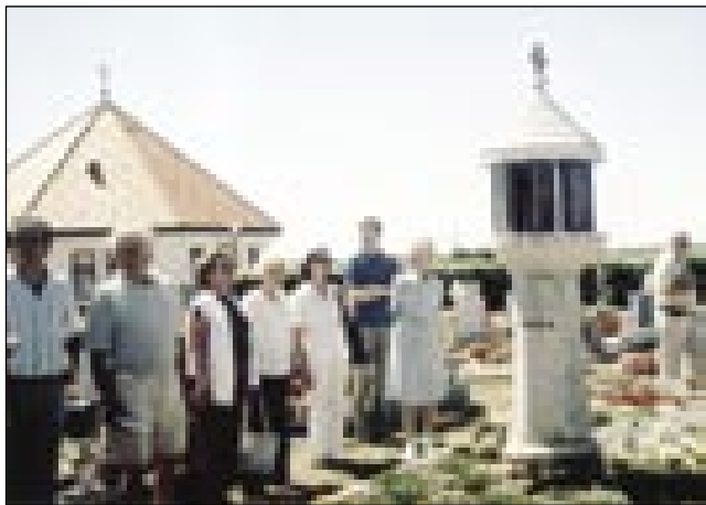
Pri spomeniki sedem manternikov v Odrancih na graubišči

Kak že par lejt, tak je Slovensko društvo v Budimpešti letos tō vodila paut pá v matično domovino Slovenijo. Šli smo na prauško na Ptujško goro. Tau romarsko mesto je pri varaši Ptuj.