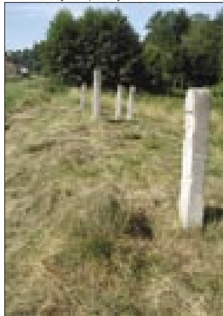
»Tüj je težko kositi, ka je puno z betonskimi sojami,« pravijo