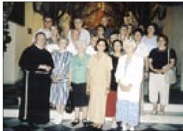
Pred oltarjem na Ptujski gori