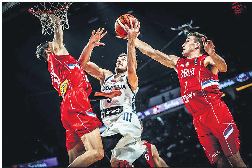
Goran Dragić je v finalu dosegel 36 točk, 26 že v prvem polčasu.