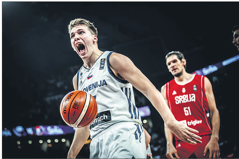
Ob Dragiću je bil v idealno peterko turnirja izbran tudi Luka Dončić.