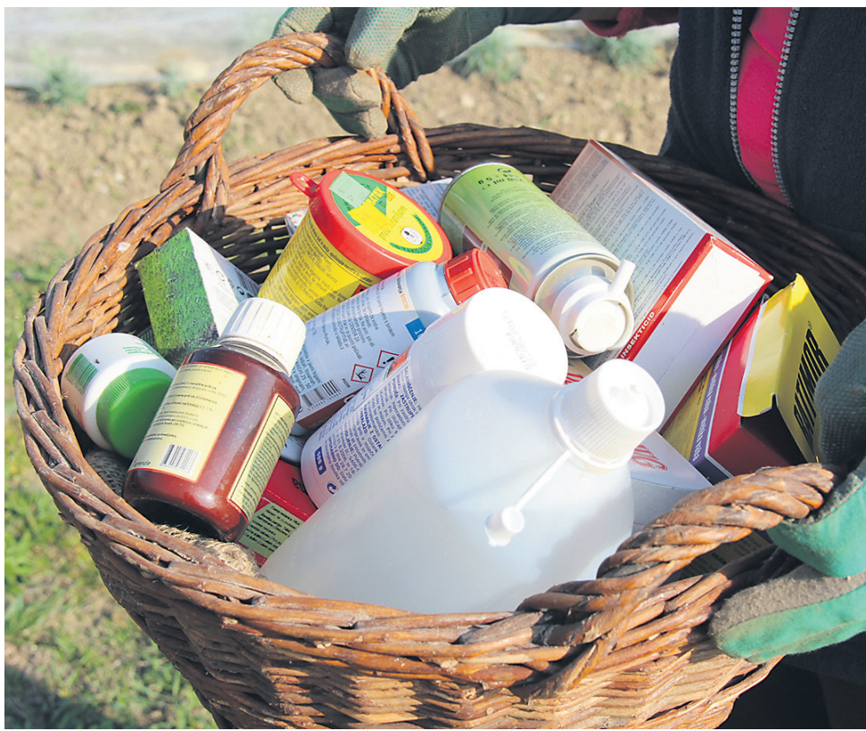
V letu 2016 so v Sloveniji prodali 860 ton fungicidov, 247 ton herbicidov, 41 ton insekticidov in devet ton drugih pesticidov.

insekticidov 41 (štirje odstotki) in drugih pesticidov devet ton (manj kot odstotek). Po podatkih statističnega urada se je lani v primerjavi z letom 2015 prodaja pesticidov skupno povečala za deset odstotkov. Sto ton več je bilo prodanih fungicidov, 23 ton herbicidov in dve toni insekticidov. Podatki prikazujejo veleprodajo pesticidov na domačem trgu, ne pa tudi dejanske porabe v posameznem letu. Poraba je namreč odvisna tudi od zaloga iz prejšnjih let, od individualnih nakupov v tujini in podobno. Podatki o prodaji tudi ne odražajo porabe pesticidov v kmetijstvu, saj se ti v resnici uporabljajo tudi za druge namene, na primer za vzdrževanje železnic in cest, igrišč za golf, parkov in zelenic.