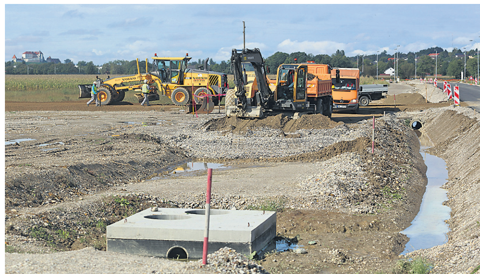
Gradbišče v Podvincih – obnova regionalne ceste, gradnja pločnikov, kolesarske steze in javne razsvetljave. Vrednost del je 1,5 milijona evrov, od tega znaša sofinancerski delež MO Ptuj okrog 600.000 evrov.

Nekaj manj kot 1,4 milijona evrov proračunskega denarja MO Ptuj se je v obdobju zadnjih štirih let vložilo v območje ČS Breg-Turnišče s 3.700 prebivalci in blizu 1.400 gospodinjstvi.