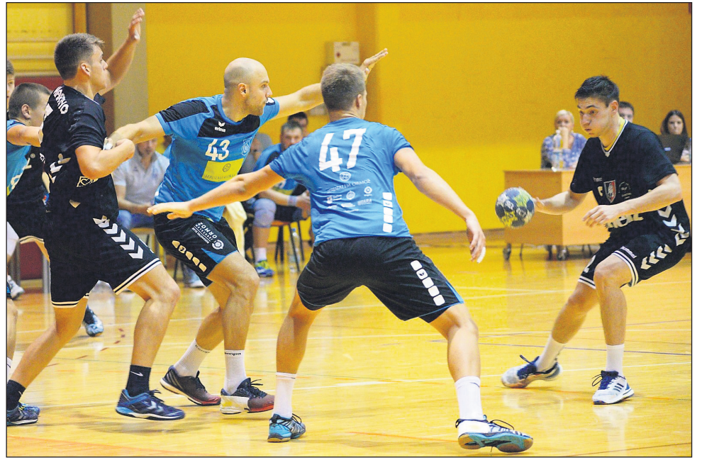
Rokometaši Ormoža so v Šmartnem strli odpor borbenih domačinov.

žali le na gol zaostanka (11:12). Na srečo je bil pri novincu