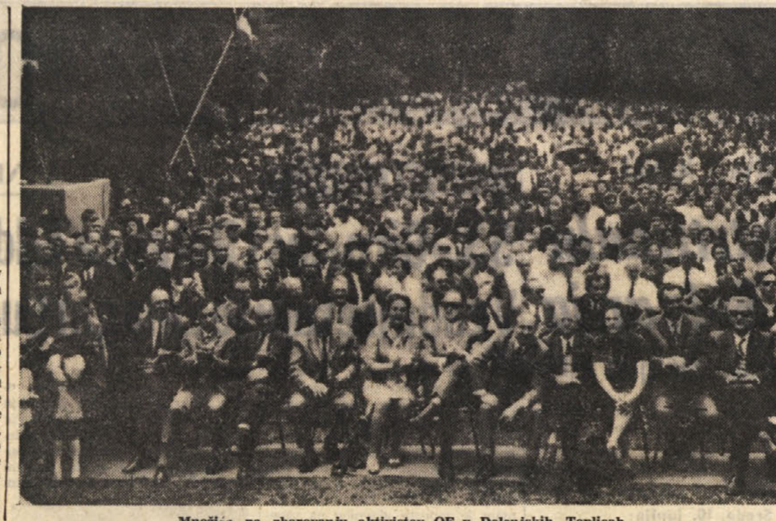
Množica na zborovanju aktivistov OF v Dolenjskih Toplicah

V prizadete pokrajine so danes od-potvale prve reševalne ekipe se-stavljene iz zdravnikov, bolničarjev in delavcev. S sabo nosijo precejšnje količine zdravil in nekaj hrane. Sovjetska komunistična partija in vla-