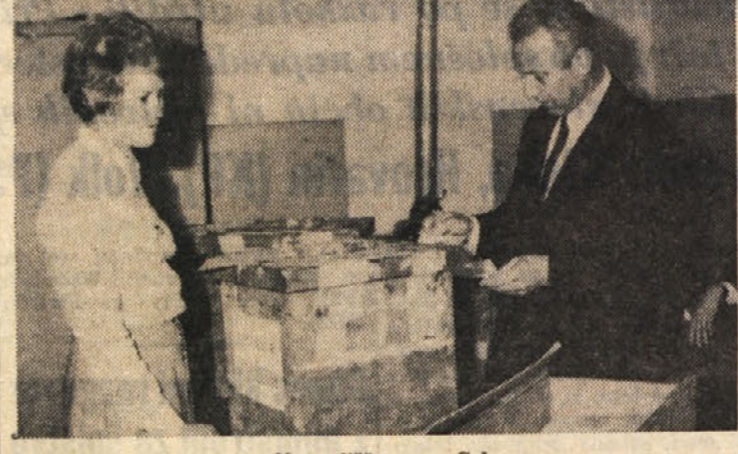
Na volišču na Colu