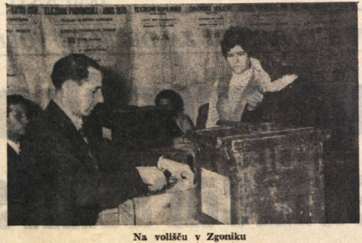
Na volišču v Zgoniku