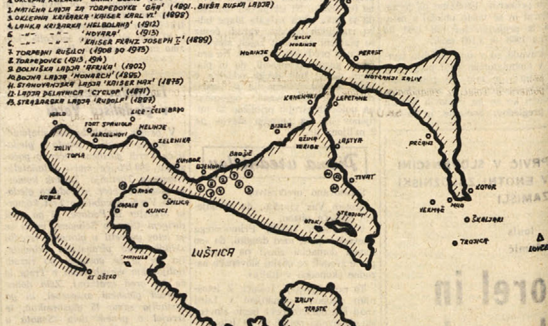
Na skici vidimo, kje so bile ladje 1. februarja, ob začetku upora