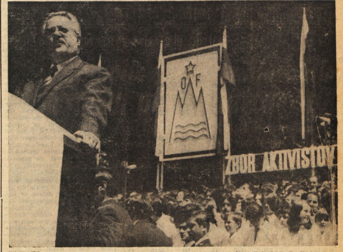
Edvard Kardelj govori zbrani množici na zboru aktivistov OF v Dolenskih Toplicah

Slavnostni govor prvega borca OF Edvarda Kardelja - Množičen obisk «baze 20» v Roğu - Tržačani, Goričani in Korošci na proslavi