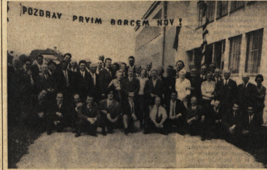
Tržaški in goriški aktivisti OF na povratku s proslave v Dolenjskih Toplicah

Izvedenci trdijo, da reki vsaj še za en teden ne bosta upadli, vendar upajo, da se položaj ne bo več poslabšal, v kolikor sta reki na madžarskih tleh vsaj delno že upadli.