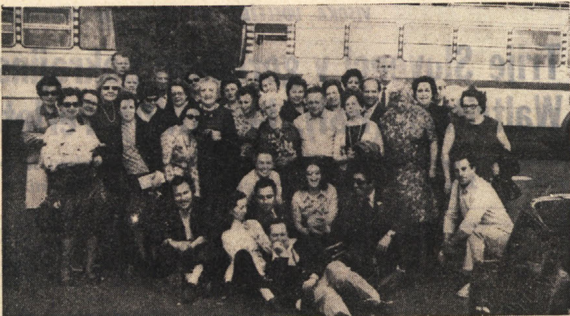
Udeleženci izleta P. d. z avtobusoma št. 7 in 8

(Vtisi iz izleta v Rim in Neapelj z okolico ter na otok Capri)