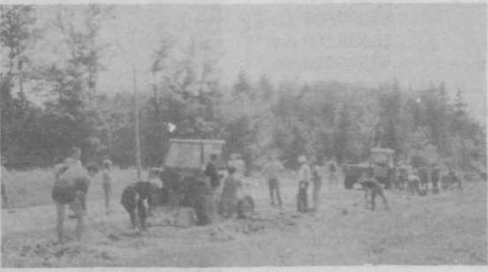
Krajevni na delovni akciji julija letos

Z delovnimi zmagami v letošnjem letu smo podkrepili praznovanje krajevnega praznika, kakor tudi praznika Občine Grosuplje.