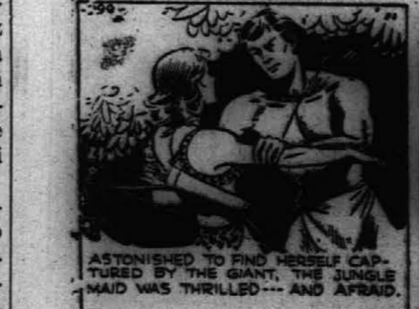
ASTONISHED TO FIND HERSELF CAPTURED BY THE GIANT, THE JUNGLE MAID WAS THRILLED — AND AFRAID.