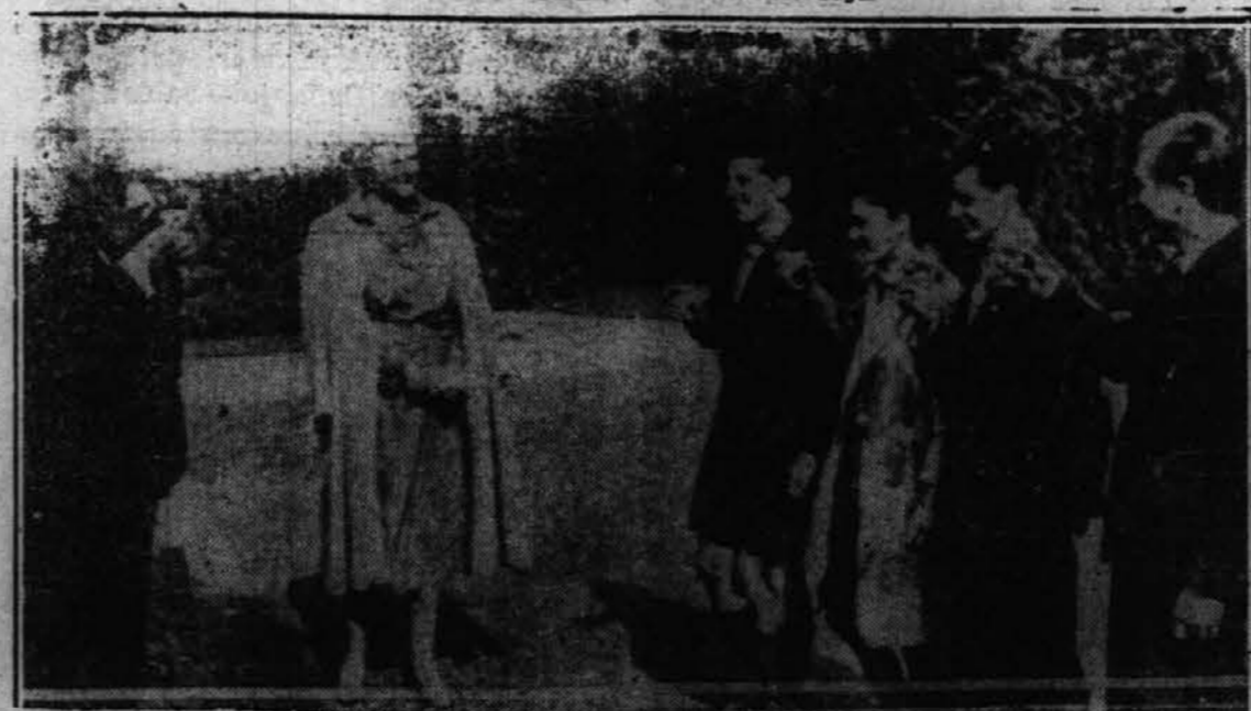
Pet mladih francoskih fantov je nedavno izvršilo drzen pobeg iz svoje domovine, zasedene od nazijev, ter z dvema čolnoma preveslalo Kanal do Anglije. Gornja slika jih kaže, ko jih pozdravljata Mr. in Mrs. Churchill.