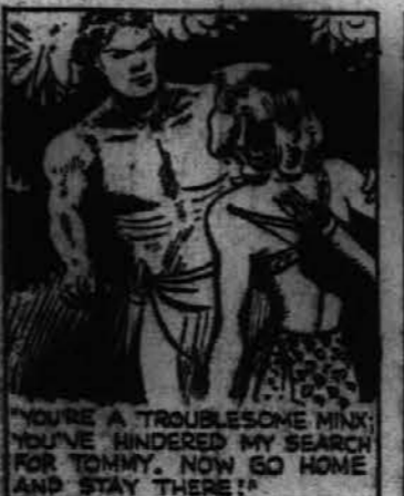
"Ti si naslednja vidra. Ti oviraš moje iskanje Tommyja. Sedaj pojdi domov in tam ostani!"