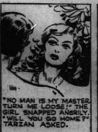
"NO MAN IS MY MASTER. TURN ME LOOSE!" THE GIRL SNAPPED ANGRILY. "WILL YOU GO HOME?" TARZAN ASKED.