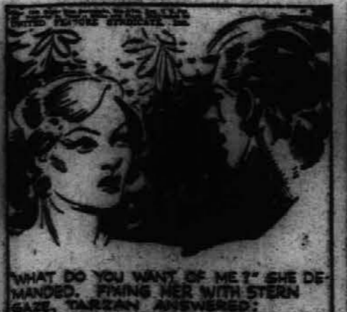
"Kaj hočeš ti od mene?" je hotela vedeti. Tarzan jo je ostro pogledal in odgovoril: