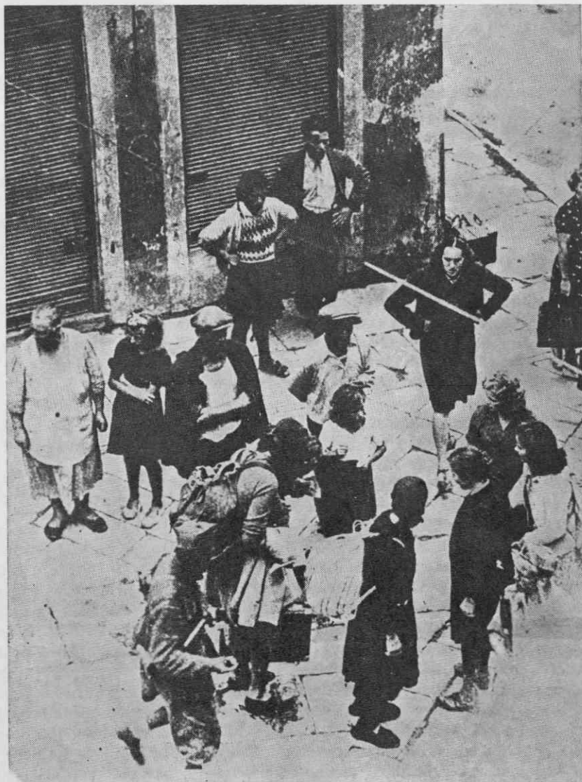
Osvoboditev političnih jetnikov iz koprskih zaporov 27. 9. 1943

Vseljidska vstaja kot ena najpomembnejših značilnosti narodnoosvobodilnega boja v Slovenskem Primorju in Istri, je zajela tudi Slovensko Istro. Izražali so jo vsi tisti pojavi kot v drugih predelih teh pokrajin: množične demonstracije ali manifestacije, razoroževanje italijanskih oboroženih sil, prevzem oblasti in organizacija uprave, splošna mobilizacija v Narodnoosvobodilno vojsko itd.