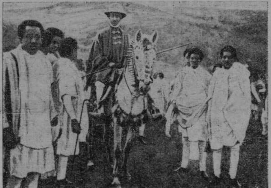
Abesinski prestolonaslednik nadzira severno bojišče.