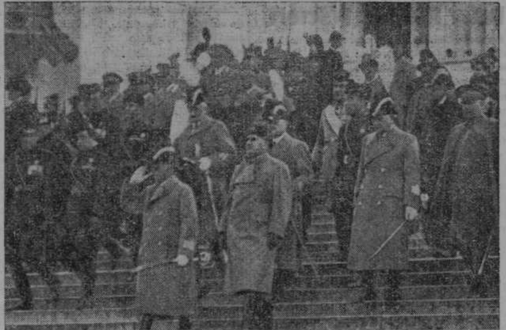
Italijanski kralj in Mussolini sta se poslovila od dveh polkov, ki sta določena za vzhodno Afriko in sta na potu h grobu neznanega vojaka.

Smarje pri Jelšah. V nedeljo, 26. januarja, priredi naša Sadjarska podružnica predavanje,