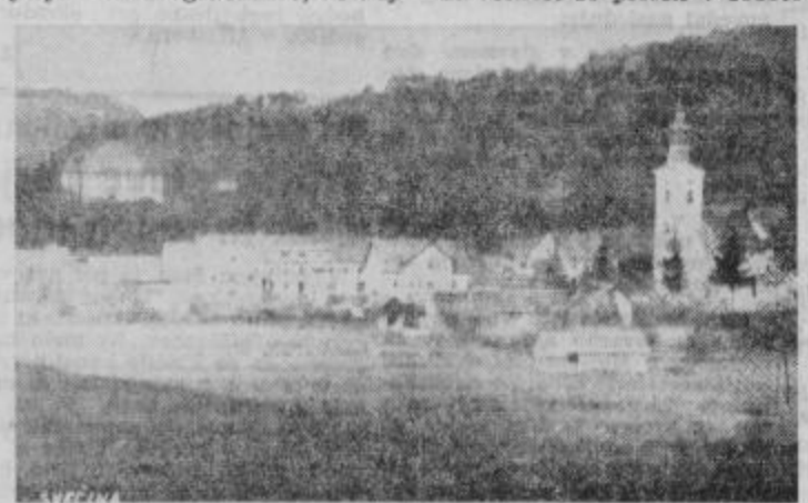
Svečina — vinarstvo-sadjarke šole v ozadju

Potrebe in zahteve naše družbe po hitrejšem napredku v kmetijstvu, po kakovostnih in cenovnih proizvodih, so upravičene in, če bo družba tudi pripravljena sanirati sedanje stanje. Pomankljivo financiranje, pomanjkanje sodobnih tehničnih naprav in strojev ter učnih objektov onemogoča normalno delo. Prenizko so odmerjena proračunska sredstva in lastni dohodki so skromni. Pričakovati je, da bo 30-letnica obstoja in delovanja šole prelomnica, ki bi naj pospešila rešitev tako političnih zadev za bodoče delo šole in za razvoj našega kmetijstva. Z R