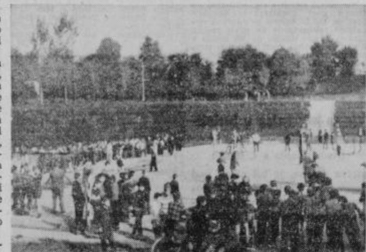
Ormoško rokometno igrišče je bilo prizorišče in množična manifestacija — »velikih« športnih bojev

Prav tako živahno je bilo med njihovimi starejšimi vrstniki, ki so se pomerili v svojih športnih disciplinah in igrah — primeren njihov starostni stopnji. Kot sem imel priložnost opaziti, dajejo v ormoški osnovni šoli telesni vzgoji ustrezno mesto in skrbijo za vsestranski duševni in telesni razvoj svojih učencev. Zavedajo se, da geslo: »Zdrav duh v zdravem telesu« ni le formalna parola in fraza, ki jo neštokrat uporabljamo in zata-