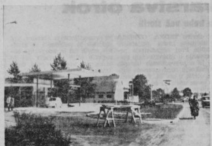
Nova bencinska črpalka. Obrat Tehnoservis v ozadju.

Poleg visokega planiranja v letošnjem letu v industrijski proizvodnji je bilo predvideno močno povečanje izvoza. Vendar