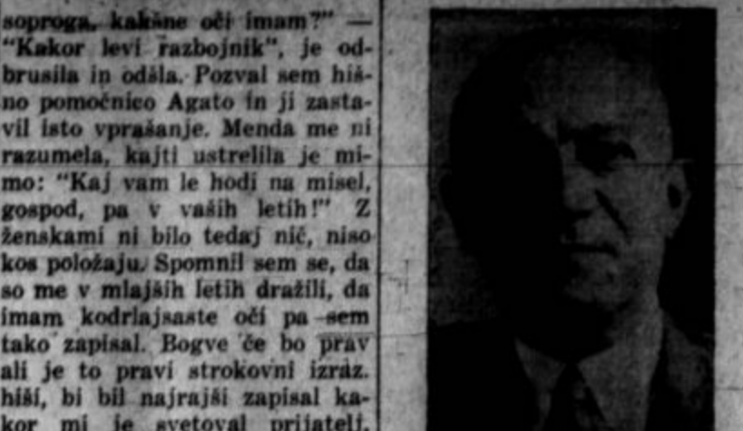
Senator Robert F. Wagner, demokrat iz New Yorka.