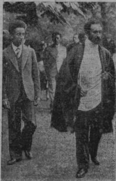
Haile Selassie, bivši abesinski cesar, s svojim starejšim sinom v Londonu.