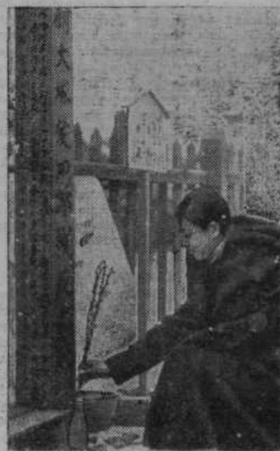
Kitajke časte spomin padlih vojakov s cveticami, katere polagajo pred posebne spominske kante,