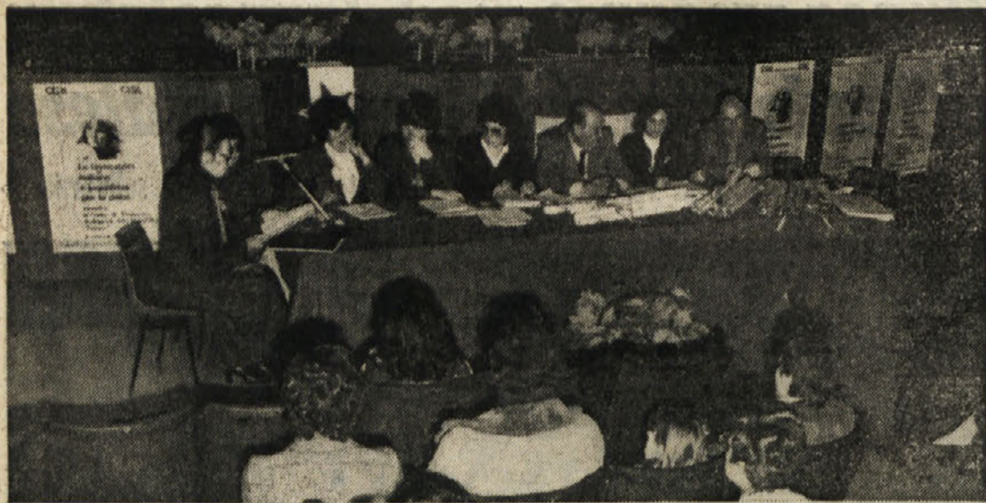
Z nedeljskega srečanja žena v Boljuncu

Na srečanju v Boljuncu so sodelovale slovenske, hrvaške in italijanske ženske - Mnogo kulturnih prireditev in družabnih večerov po naših vaseh