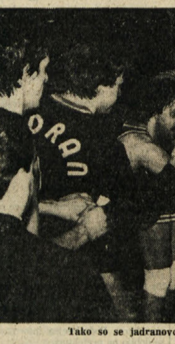
Tako so se jadranovci veselili po sobotni prvenstveni zmagi nad Servolano