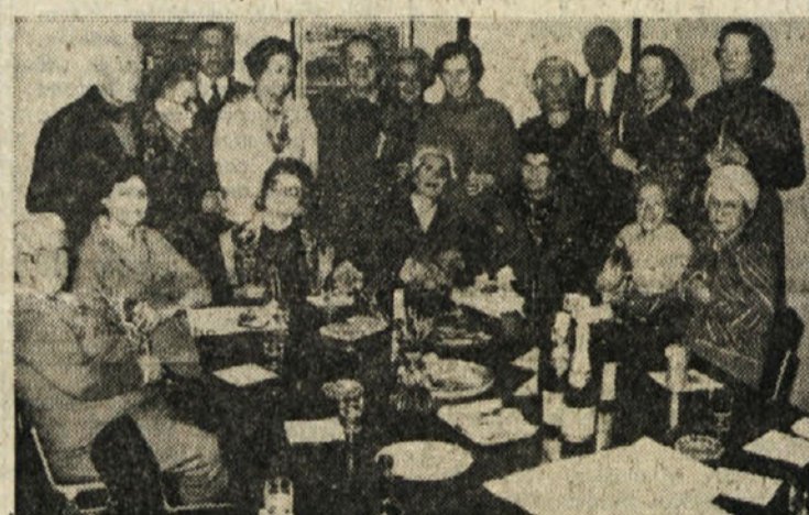
V Gregorčičevi dvorani (SPDT)