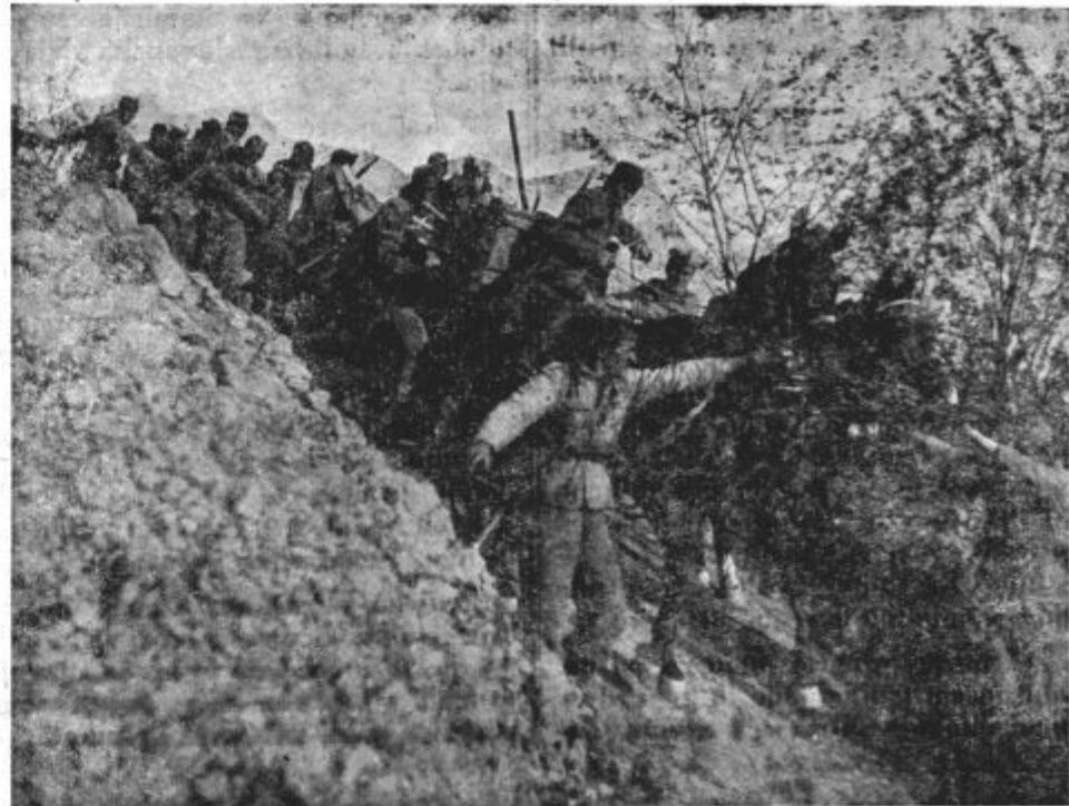
Naša vojska je bila kos tudi najtežjim terenskim oviram

Trupla umorjenih žena, otrok, mož... Po izpovedi ljudstva je bilo taborišče z ujetniki - ranjenci zažgano; bežeče so neusmiljeno postrelili. Ista slika z množestvenimi grobovi zverinsko umorjenih se nam nudi v Ocepljenki, Tarnici in drugod.