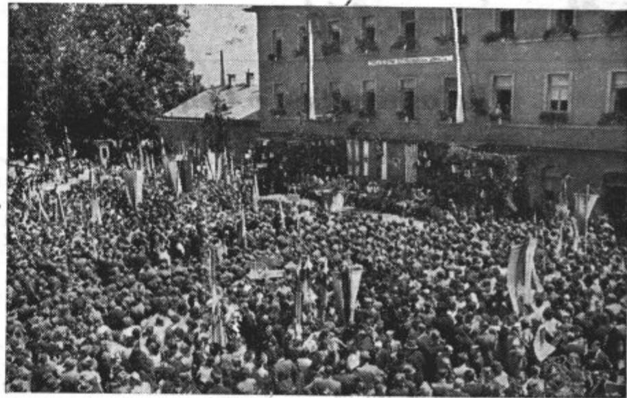
Celje dokazuje svojo pripadnost k Titovi Jugoslaviji

Tudi na Hrvaškem, kjer je okupator sistematično rušil železniške proge, se te obnavljajo in bo na glavnih progah v kratkem času zopet vzpostavljen redni železniški promet.