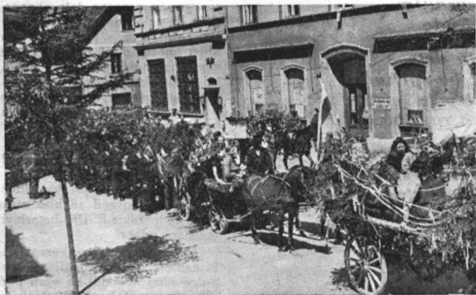
Povorka po celjskih ulicah

z ljubeznijo, požrtvovalno in z vsemi silami za novo, Titovo Jugoslavijo!