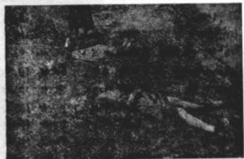
Take sledove so puščali za seboj fašistički zločinci na begu iz naše domovine...

Na zverinski način pomorjene žrtve fašističnega nasilja nam ne bodo pustile mirovati, dokler ne bo kaznovan zadnji vojni zločinec!