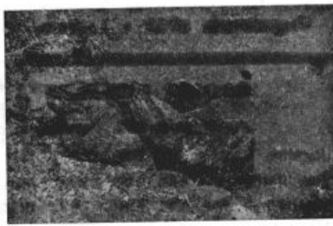
Do smrti zmučene žrtve so zmetali v vodo

... da je na Gorenjskem in na Štajerskem leta 1941-42 padlo vsak dan na stotine talcev. Mnogi so si morali sami izkopati grobove in pokopavati drug drugega!