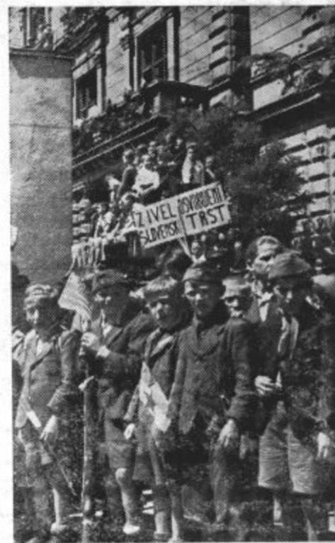
Naši pionirčki manifestirajo

V nedeljo 10. junija bo okrožna konferenca Zveze slovenske mladine, na ka-