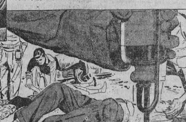
WHEN I CAME TO, THE AMBULANCE WAS THERE. THEY GAVE EACH OF US A COUPLE OF BLOOD TRANSFUSIONS. WE ALL PULLED THROUGH— THANKS TO THE BLOOD THAT WAS THERE JUST WHEN WE NEEDED IT.