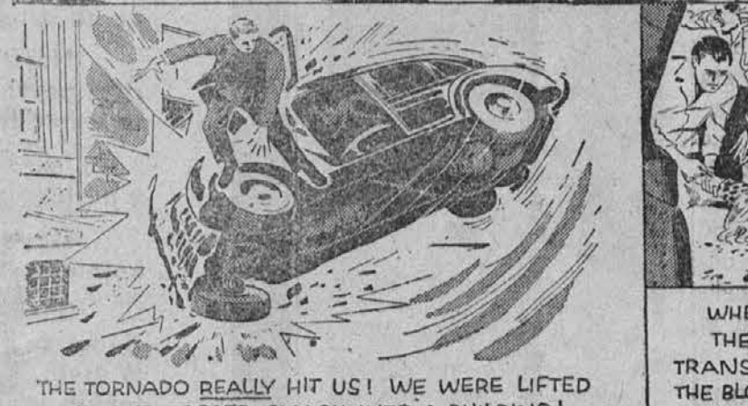
THE TORNADO REALLY HIT US! WE WERE LIFTED UP AND TOSSED SMACK INTO A BUILDING!