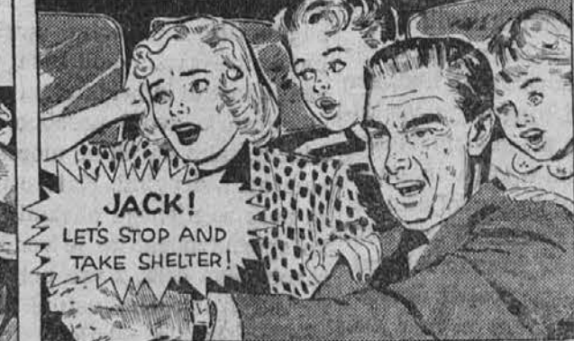
AND I STARTED TO PULL OVER TO THE CURB, WHEN—