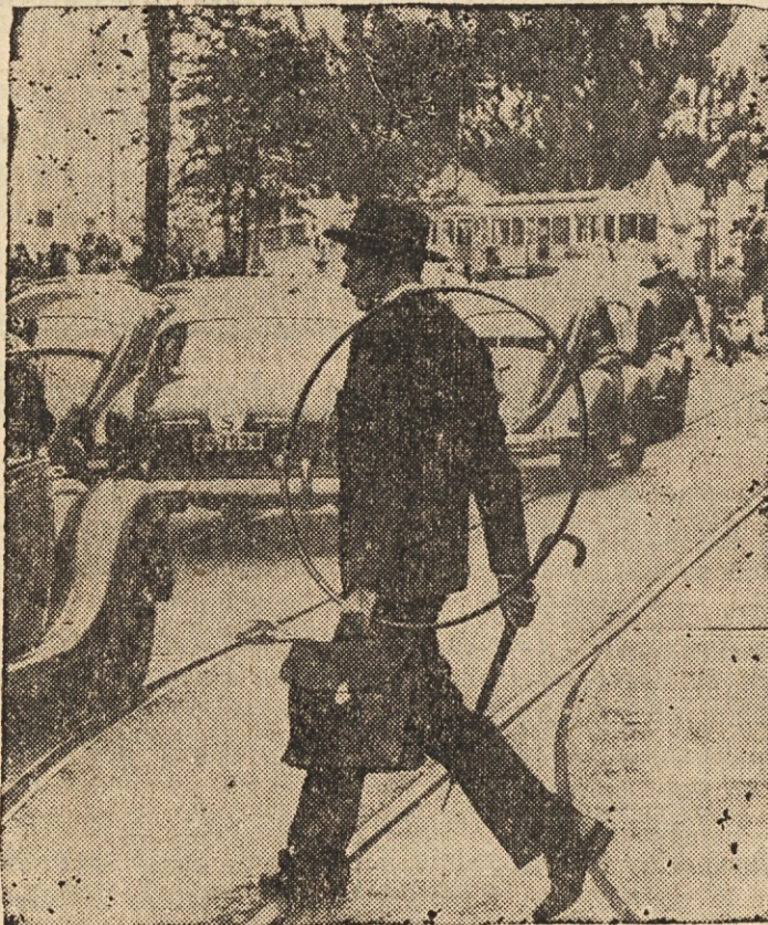
NA SVEDSKEM SE SE NISO NAVELICALI — Vrtenje obročev je prišlo v naši deželi že nekam iz mode, na Švedskem, kjer so se kerneje vneli za to norost, je pa še vedno v veliki časti. Mož na sliki v prestolnici Stockholm je kupil obroč, da ga ponese svoji hčerki.

— Tornadi so se pojavili v vseh državah dežele razen v Nevada.