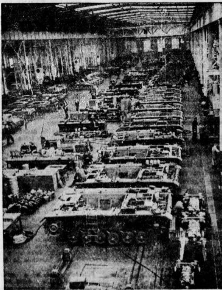
Ultra graditev nemških tankov. (Pogled v nemško tovarno.)

Bukarešta, 8. junija. AA. Reuter. Velike poplave v Rumuniji so povzročile v velikih pokrajinah veliko škodo V več krajih je bil utavljen železniški promet. Zaradi poplav grozi tudi setvi velika škoda.