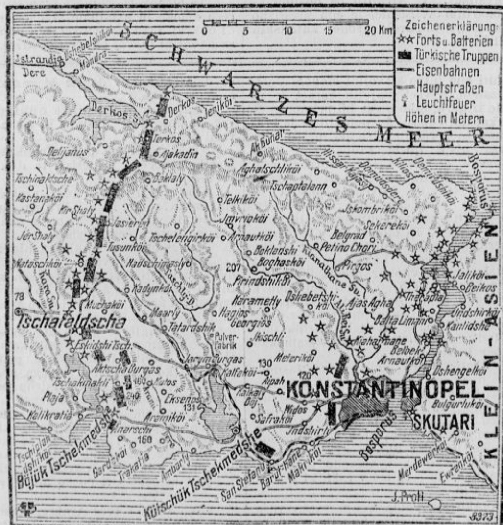
Zemlj. vid k prodiranju Bulgarov v Carigrad.

Divje beži prebivalstvo Makedonije in Trakije proti morskemu obrežju na vse strani: v Solun, Kavalo, Lagos, Dedeagač in v Carigrad. Prvi beže turški uradniki. Dokler so še vozili vlaki iz Odrina in iz Lozengrada v Dedeagač in v Carigrad, so begunci poizkušali se voziti. Vsi vozovi in tudi strehe železniških voz so bile beguncev prenapolnjene. Strojevodje pripovedujejo strašne podrobnosti. Po bitki pri Lüle Burgasu se je peljal vlak v Carigrad. Bil je prenapolnjen beguncev. Ze se premika, kar splezajo begunci na stroj, a strojev drog je vrgel veliko beguncev v stran, da so bili povoženi; tisti pa, ki so čez drog splezali, so se spekli na vročem kotlu in so popadali na tla. Kolesa stroja so bila krvava, ko se je vlak pripeljal v Carigrad. Begunci so streljali na vlake, da jih ustavijo in se z njimi odpeljejo. Več železničarjev je bilo ubitih, druge so Turki ranili. Na neki postaji so tur-