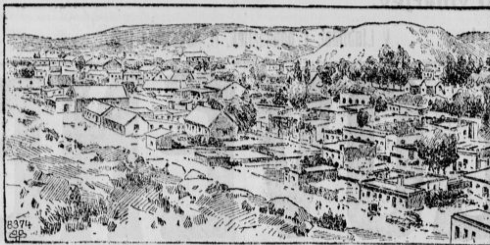
Pogled na Čataldžo.

tom tudi rešilo preporno vprašanje, čegar je Sandžak. Tudi za male države so gospodarske koristi gonilo v politiki.