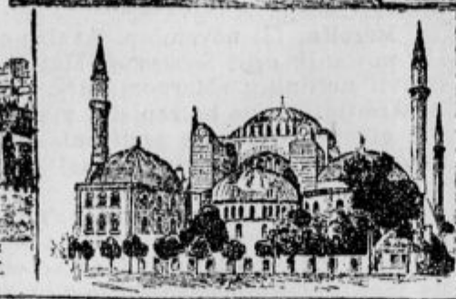
Turški parlam. nt.