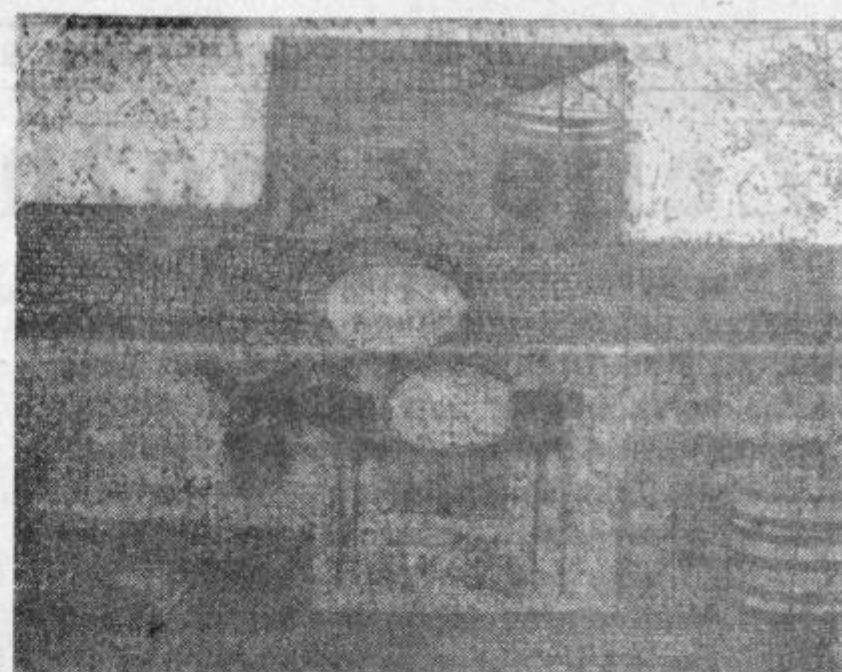
Vladimira Makuc; Motio iz Makedonije. Barona jedkarnica in akvatinta (Ljubljana 1962)