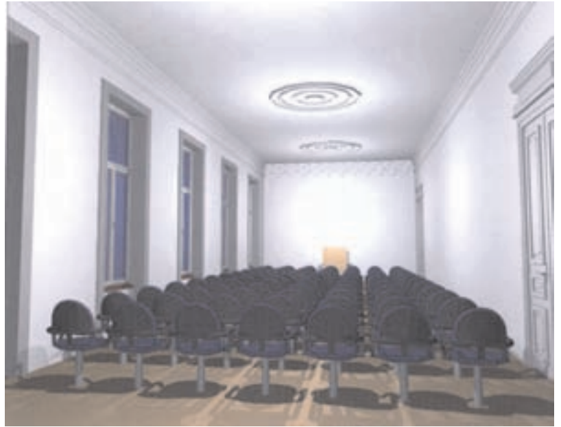
Predlogu reditve dvorane za posvete, predavanja