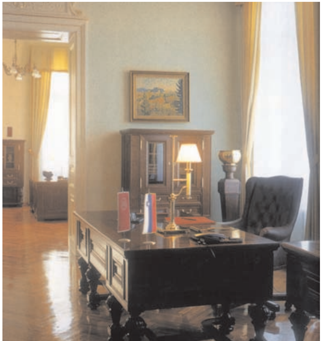
Novi rektorjevi prostori