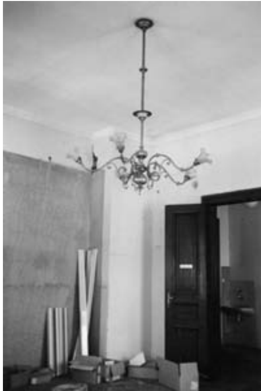
Stanje pred prenovo