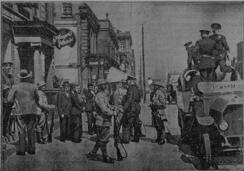
Nemiri na Irskem. V mestu Belfast je došlo do spopadov med katoličani in anglikanskimi protestanti. Slika nam predstavlja nastop policije proti izgrednikom.