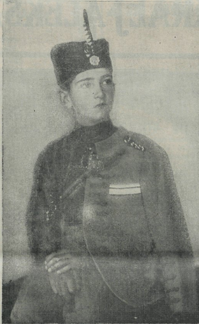
Nj. Vel. kralj Peter II.

Iz kabineta predsednika ministrskega sveta št. 220 od 9. oktobra 1934. leta.