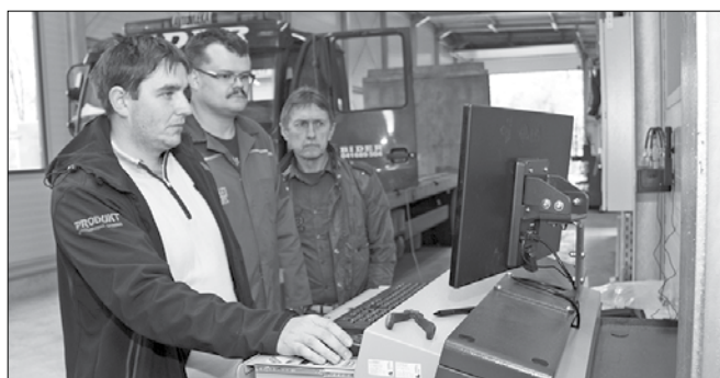
Najnovejša tehnična oprema omogoča hitre in natančne preglede ter meritve, kar vpliva na varno uporabo motornih vozil.