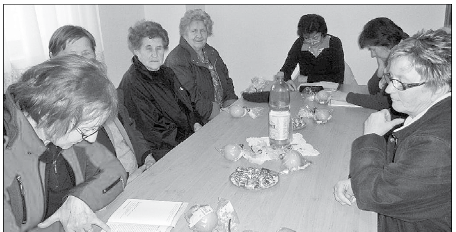
Srečanja v Lačji vasi so bila namenjena tudi pogovoru o težavah, s katerimi se starejši občani soočajo pogosteje od mlajših.

Zavolovškova je udeleženkam v štirinajstih