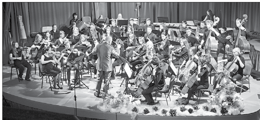
Oder doma kulture v Nazarjah so zavzeli člani Simfoničnega orkestra GŠ Fran Korun Koželjski.