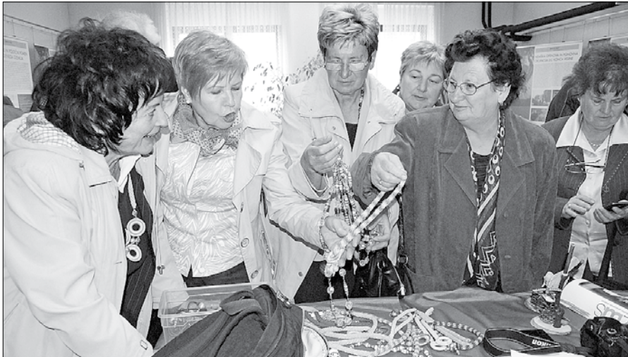
ZDUS in njegova komisija za tehnično kulturo se trudita, da se rokodelstvo razvija, da stara znanja ne gredo v pozabo.