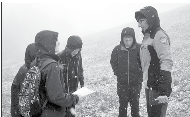
Kljub zimskim razmeram so planinci uspešno opravili celotno orientacijo in svoje znanje izkazali tudi na kontrolnih točkah.