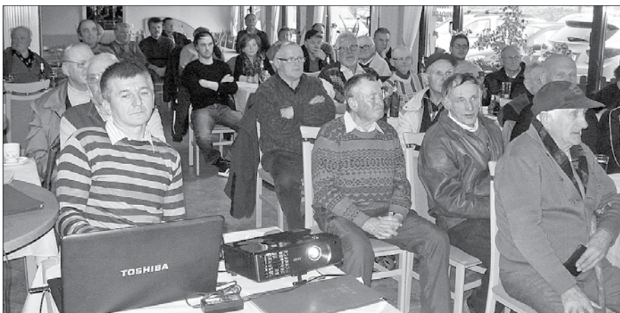
V razpravi so udeleženci izpostavili vprašljivo učinkovitost zdravil, ki jih čebelarjem za zatiranje varoje preskrbi država.