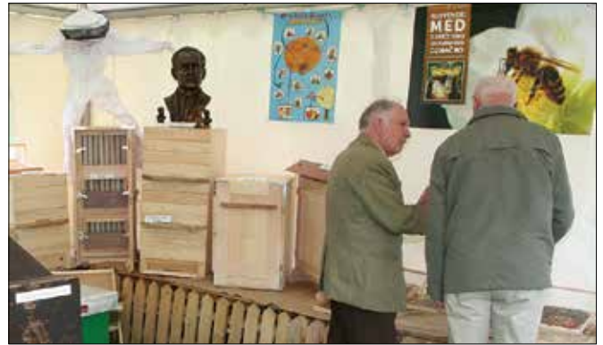
V posebnem šotoru je na ogled postavljena razstava čebelarških pripomočkov.