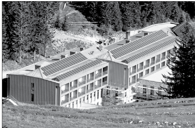
Turistični kompleks na Mozirski planini pestijo krediti, težave največjih solastnikov PV Invest in HTZ ter nekaterih drugih.

zimske sezone je razmere oteževal močan veter, ki je kar nekajkrat odpihnil snežno plast, zasneževanje pa je bilo oteženo ali celo onemogočeno, a so kljub temu uspeli organizirati tekme svetovnega pokala v telemark smučanju.