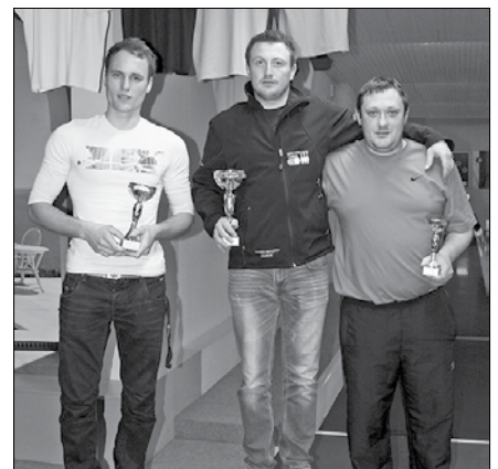
Najboljši kegljači med ljubenski gasilci.

V organizaciji Kegljškega kluba Ljubno ob Savinji so tudi tamkajšnji gasilci na kegljaškem tekmovanju, ki je potekalo v kegljišču Ermenc na Ljubnem, dobili najboljšega v tej športni zvrsti. Ob koncu sezone so se gasilci kegljači pomerili v tekmovanju parov in na osnovi teh rezultatov prišli do posamičnega zmagovalca.