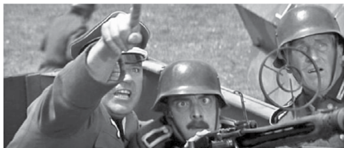
K sreči je bila nemška učinkovitost pogosto na preizkušnji.

Moja mama si je enkrat zaželela močno kavo. V tem je zraven naše hiše padla bomba, ki ni eksplodirala. No, je rekla, kave ne potrebujem več. Dokler bo ta reč tu, se mi že ne bo spalo.