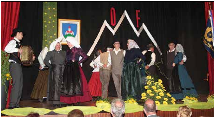
Nastop folkloristov skupine Oštarija, ki jo sestavljajo plesalci iz Bočne in Mozirja.