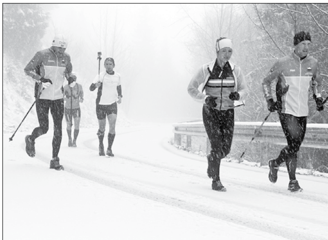
Tekači so po dobri uri po petih centimetrih svežega snega utrjeni in dodobra premočeni pritekli do hotela na Golteh.