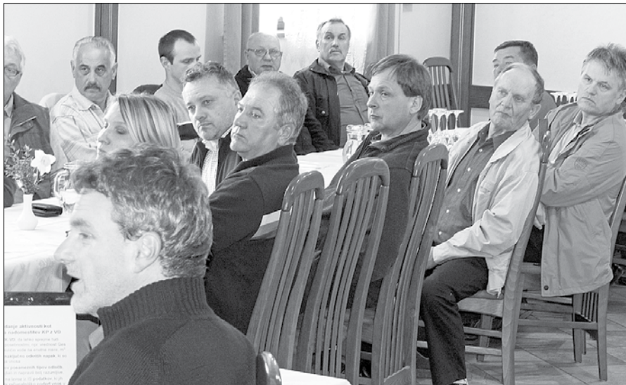
Gospodarji malih hidroelektrarn v naši dolini si želijo primerljivo odzivnost države z Avstrijo, ki izkorišča 90 odstotkov vodnega potenciala.