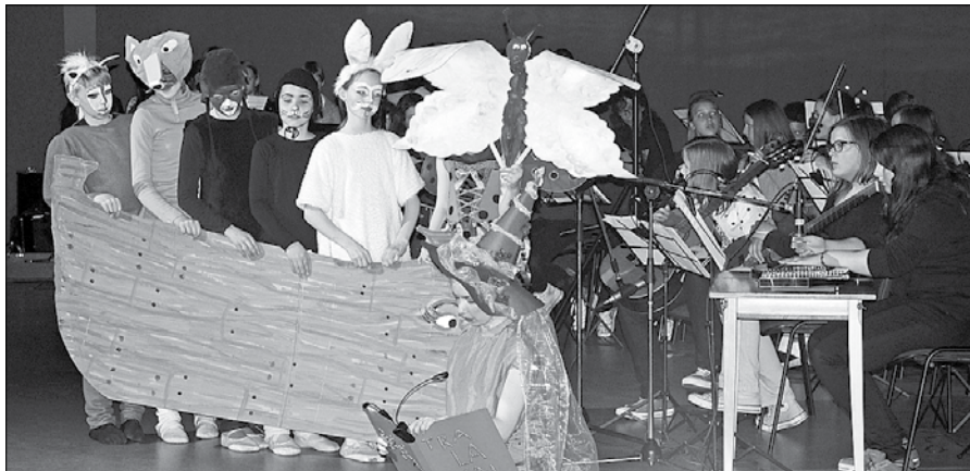
Glasbena pravljica učencev in profesorjev Glasbene šole Nazarje o deželi Tralalaj, »kjer še listi šelestijo v ritmu melodij«.

SIMFONIČNI ORKESTER GLASBENE ŠOLE FRAN KORUN KOŽELJSKI