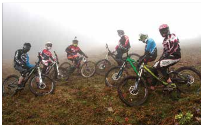
Gorski kolesarji Beli zajec - Downhill team so na praznik dela prvič preizkusili progo za kolesarje na Golteh.