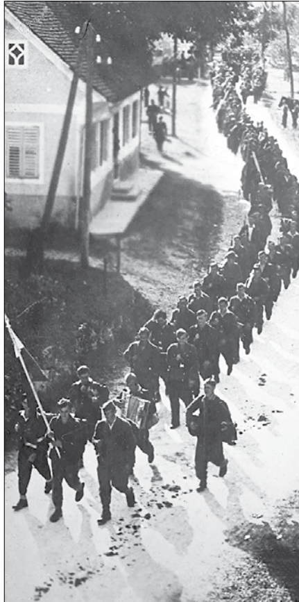
Pohod Zidanske brigade skozi Gornji Grad (Fotodokumentacija MNZC)

Posledice okupacije so prebivalci naše doline