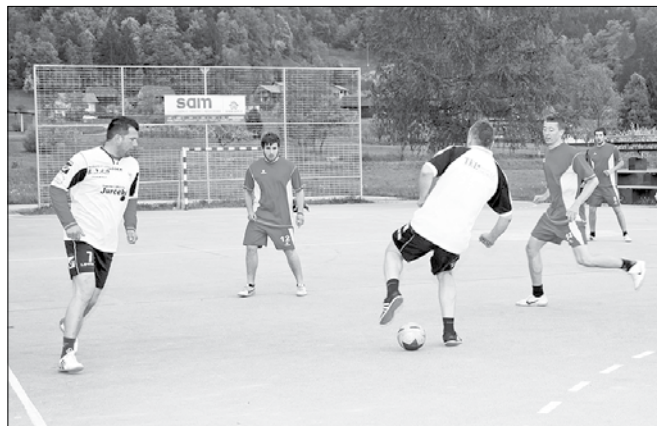
Na igrišču ob Dreti so dvanajst ur svoje moči preizkušali stari in mladi.

Športno društvo Vrbovec Nazarje je ostalo zvesto tradiciji in pripravilo maraton v malem nogometu. S 36. tovrstnim športnim dogodkom so proslavili praznik dela. Na igrišču ob Dreti so svoje moči in znanje merili stari in mladi. Na strani starih so zaigrali nogometiški športni društva Vrbovec, Gornji Grad in Nova Štifta ter ekipa Izoles. Pri mladih so svoje moči merili Nazarje, ŠD Vrbovec, ŠD Gornji Grad in Zadržka.