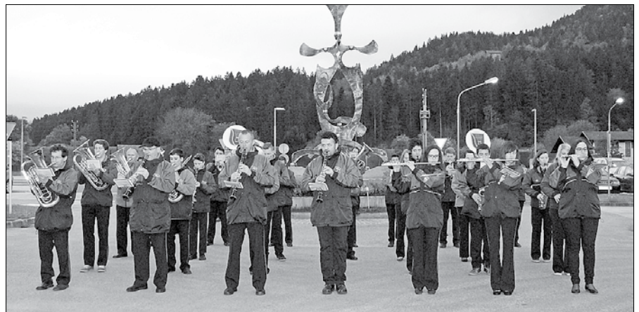
Člani zgornjesavinjske godbe so ob šestih zjutraj pred podjetjem KLS zaigrali zaposlenim v nočni izmeni, ko so odhajali iz službe.