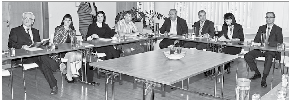
Zavzeto delo in konstruktivna razprava na 9. seji upravnega odbora SŠGZ

to priznanje v kategoriji inovacij, ki niso bile deležne profesionalne podpore, letos pa se je število prijavljenih inovacijskih projektov povzpelo na osemnajst.