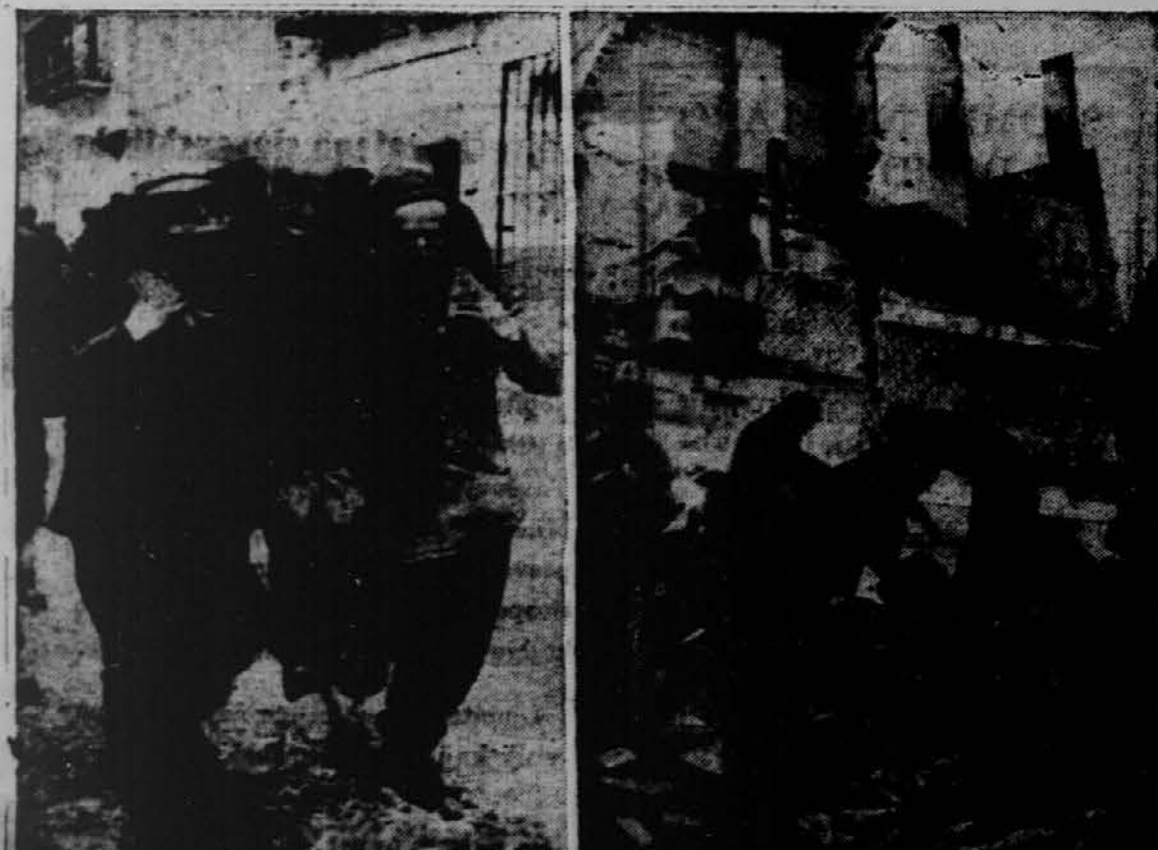
Španski republikanski vojaki pomagajo stareku na varno in i čejo med razvalinami ranjenec.