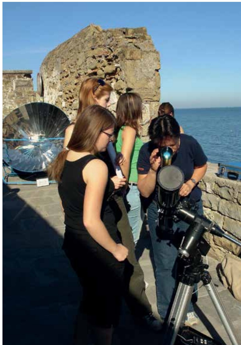
Slika 2: Dijaki opazujejo Sonce in merijo temperaturo na sončni peči na mednarodnem taboru v Piranu, Menata 1, september 2004.

Naj na tem mestu opišem pozitivno izkušnjo, kako šola lahko pomaga zmanjšati prispevek dijaka. Organiziral sem enodnevni tabor na Krimu, ker sem dijakom