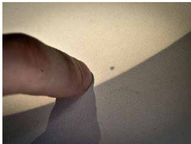
Slika 6: Prehod Merkurja na zaslonu, 9. maj 2016

Osnovna dilema je, kako številan naj bo tabor. Na ogled redkih pojavov, ki se dogajajo podnevi (Sončni mrki in prehod planetov preko Sončeve ploskvice) in jih lahko opazujemo na šoli ali v njeni bližini, povabimo vse dijake, vabilo je lahko tudi širše. Poskrbimo za zadostno število očal za opazovanje mrka in omogočimo opazovanje dogodka na zaslonu. Za projiciranje na zaslon v zasenčenem prostoru (na opazovališču) je dovolj že manjši teleskop (npr. z daljnogledom 10 x 50). Še boljše pa je teleskop (npr. Coronado) s filtrom in primeren fotoaparati ali kamero povezati z računalnikom in v zatemnjenem prostoru (učilnica ali priložnostni šotor na opazovališču) na platno projicirati dogajanje na nebu. S projiciranjem dosežemo, da dogodek doživi več dijakov (opazovalcev), kar je še posebej pomembno pri Sončevem mrku, kjer največja faza traja le kratek čas. Včasih lahko redke dogodke približamo širši javnosti preko interneta – če imamo na voljo ustrezno opremo in znanje – je pa to dodaten izziv tako za mentorja kot za dijake. Nekoliko drugačno je opazovanje Luninega mrka, ker traja dalj časa in se dogaja ponoči. Dijake na primerno lokacijo odpeljemo že popoldne, tam izvedemo predpripravo in nato opazujemo.