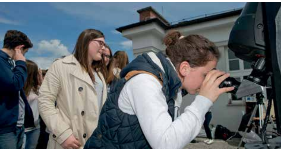
Slika 5: Prehod Merkurja na zaslonu, 9. maj 2016. Dijaki opazujejo prehod na terasi Gimnazije Jožeta Plečnika Ljubljana.