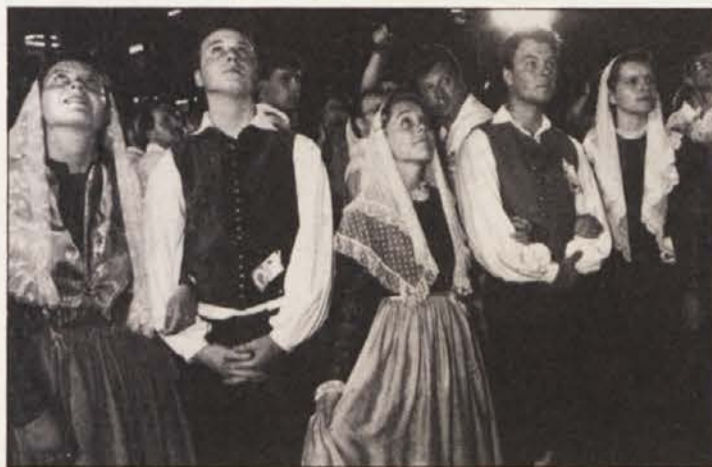
Zgodovinski in vesel trenutek za Slovenke in Slovence: uradna inavguracija države se je končala s himno in s protokolarnim obredom zamenjave dosedanje z novo slovensko zastavo.