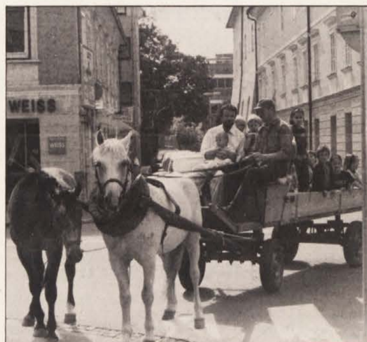
Atrakcija za otroke: s kočijo po celovških ulicah