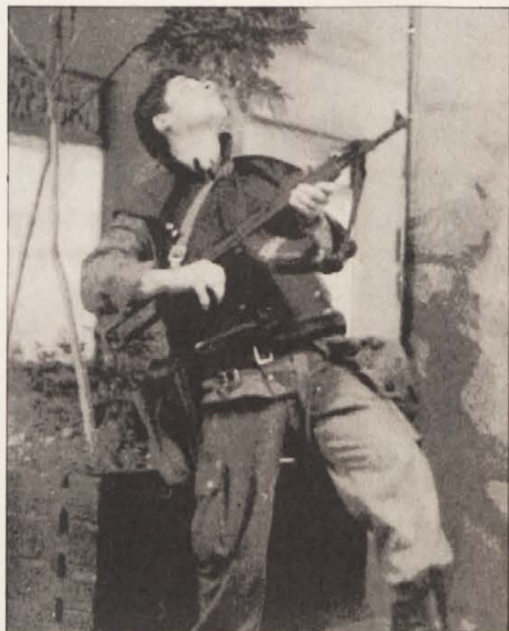
Pripadnik slovenske specialne enote v akciji