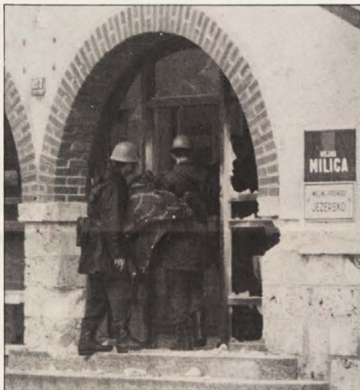
Do hudih spopadov med slovenskimi teritorialci in vojniki jugoslovanske vojske je prišlo tudi na mejnem prehodu Jezersko, ki je od ponedeljka dalje spet odprt in v slovenskih rokah

Slovensko predsedstvo je takoj po začetku prodiranja odpoklicalo slovenske vojake in oficirje iz sestava JA, vojake iz ostalih republik pa je pozvalo, naj se ne borijo proti slovenskemu narodu, v primeru prebega na slovensko stran pa jim je zagotovilo