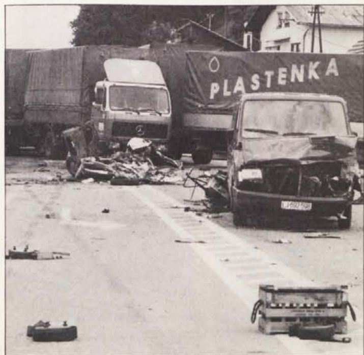
Po vsej Sloveniji so z avtomobili, tovornjaki in minami ustavljali vojsko