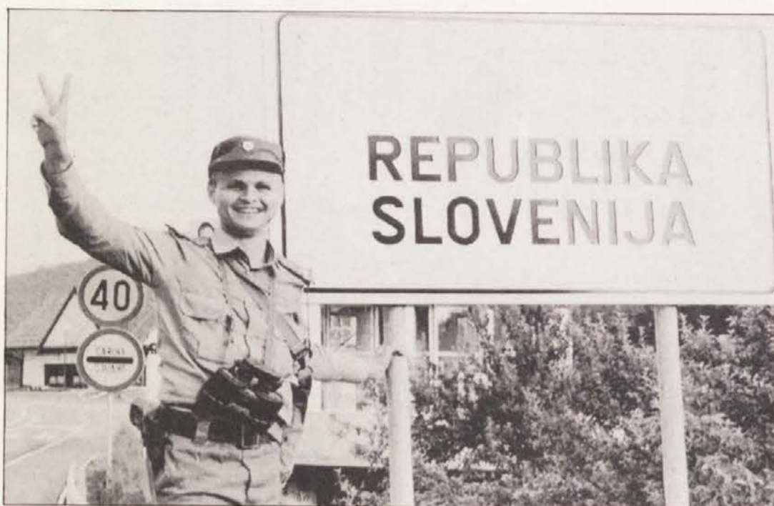
Pripadnik teritorialne obrambe po ponovnem prevzemu mejnega prehoda ob avstrijsko-slovenski meji