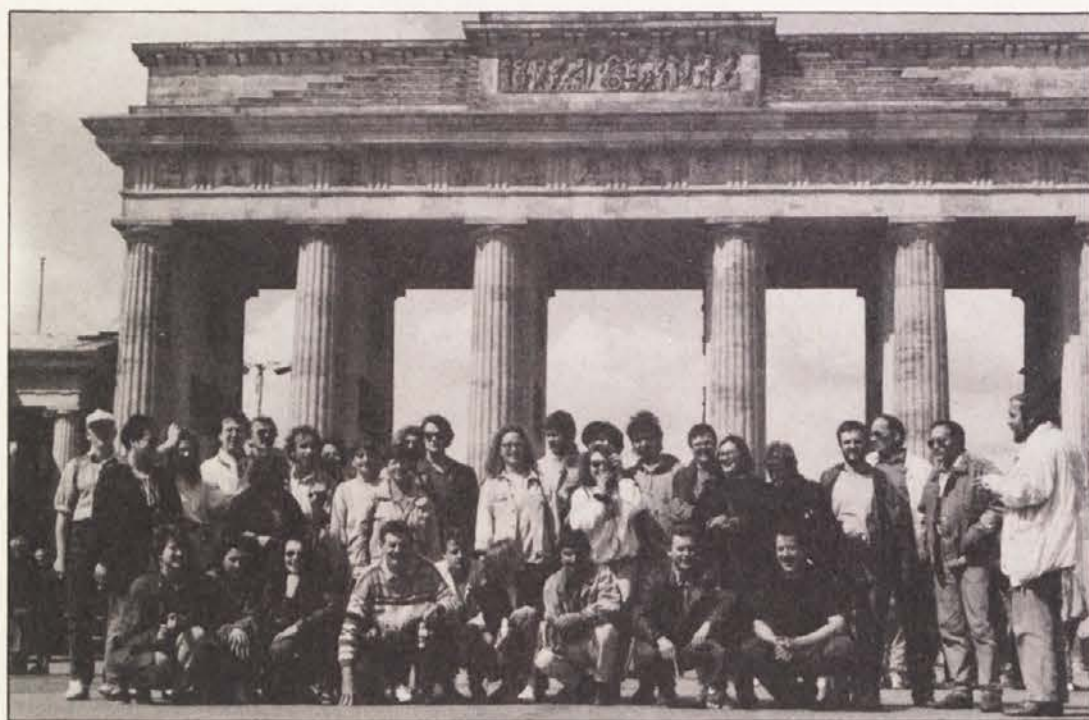
Udeleženci potovanja pred Brandenburškimi vrati sredi Berlina, novega nemškega glavnega mesta.

Oddelek Škofiče - 4. julija 1991 ob 19. uri v društveni sobi (nad posojilnico) v Škofičah.