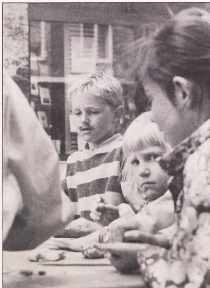
Zgodaj že vadi, kdor hoče postati lončar...