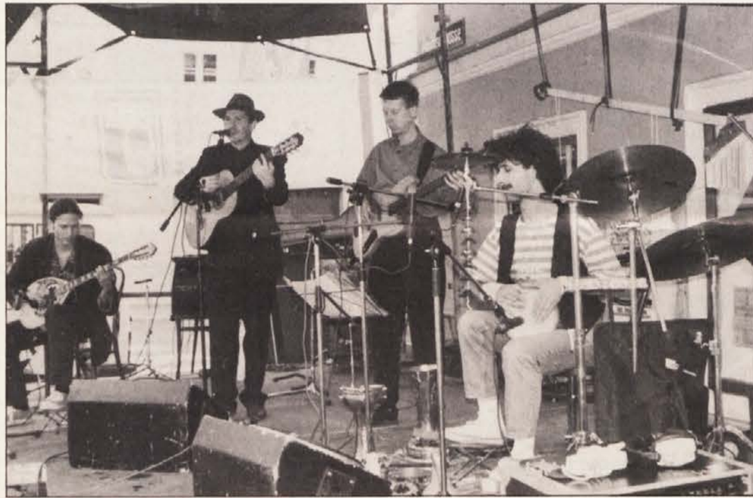
Simbol spajanja raznih kulturnih tokov: člani skupine Wiener Tschuschenkapelle.