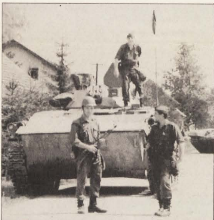
Tanki jugoslovanske armade so uničili ceste in blokirali promet

Takoj po zasedanju slovenske skupščine prejšnji torek, 25. junija, na katerem so bili sprejeti še zadnji trije osamosvojitveni akti, je ponoči s 25. na 26. junij zvezna vlada sprejela sklepe in ukaze, „ki naj bi zagotovili normalno delovanje države SFRJ“. In medtem ko so slovenski policisti na slovenskih mejnih prehodih zamenjevali napise SFRJ z Republiko Slovenija in obešali slovenske zastave, so med zveznima sekretariatoma za notranje zadeve in obrambo potekale zadnje priprave za eskalacijo proti Sloveniji za izvršitev teh sklepov. Milan Kučan, predsednik predsedstva Slovenije, je 26. junija zvečer v svojem slavnostnem govoru na ljubljanskem Trgu revolucije še dejal, da Slovenija z osamosvojitvijo ne podira mostov s preostalo Jugoslavijo, še isto noč pa jih je s Slovenijo začela rušiti jugoslovanska armada.