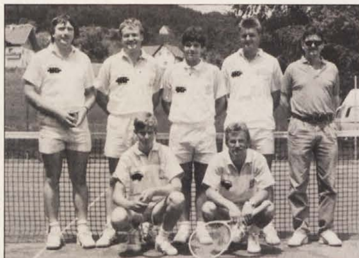
Druga ekipa Bilčovsa je brez možnosti za naslov.

porazih seveda nima več nobenih izgledov za naslov, kljub temu pa je tudi druga ekipa potrdila, da je teniški šport med Bilčovščani zelo priljubljen.