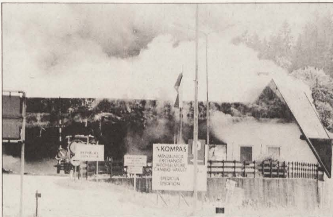
Vojaki jugoslovanske armade so povsem uničili mejni prehod na Holmcu pri Pliberku

konferenci je predsednik slovenske vlade Peterle Jugoslovansko ljudsko armado preimenoval v okupatorsko in Slovenija je v tem smislu začela z njo tudi postopati.