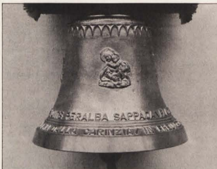
Die bronzene Alpenglocke

Kärnten ausgehen Alpin-Freundschaftstreffen hervor, wobei u.a. besonders herausgestrichen wurde, daß diese Nachbarschaftsbesuche mit Veranstaltungen vom gemeinsamen Willen der Kontaktnahme und Freudebrin-