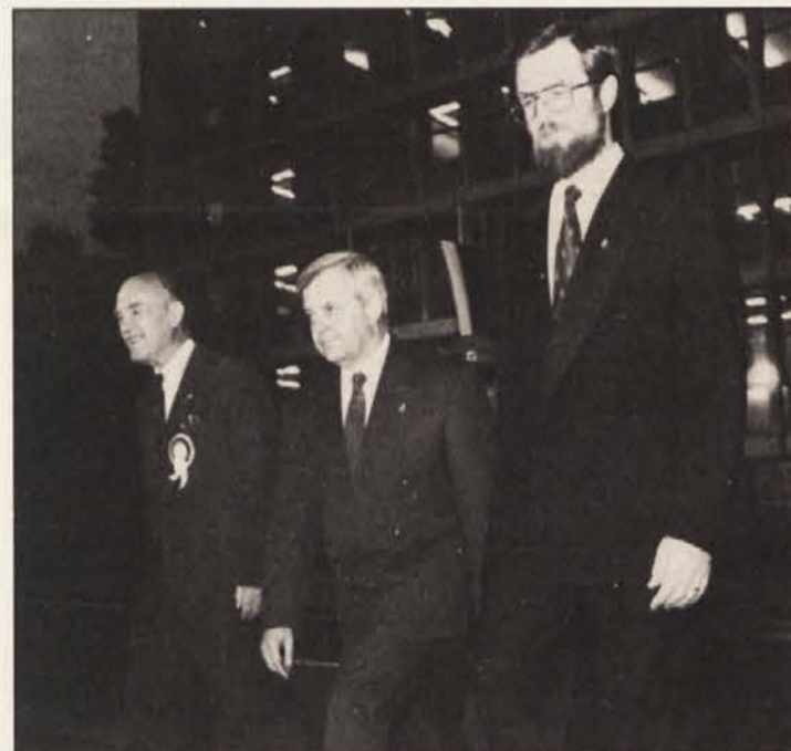
Predsednik skupščine France Bučar, predsednik predsedstva Slovenije Milan Kučan in ministrski predsednik Lojze Peterle na poti k slavnostni razglasitvi samostojne države Slovenije.