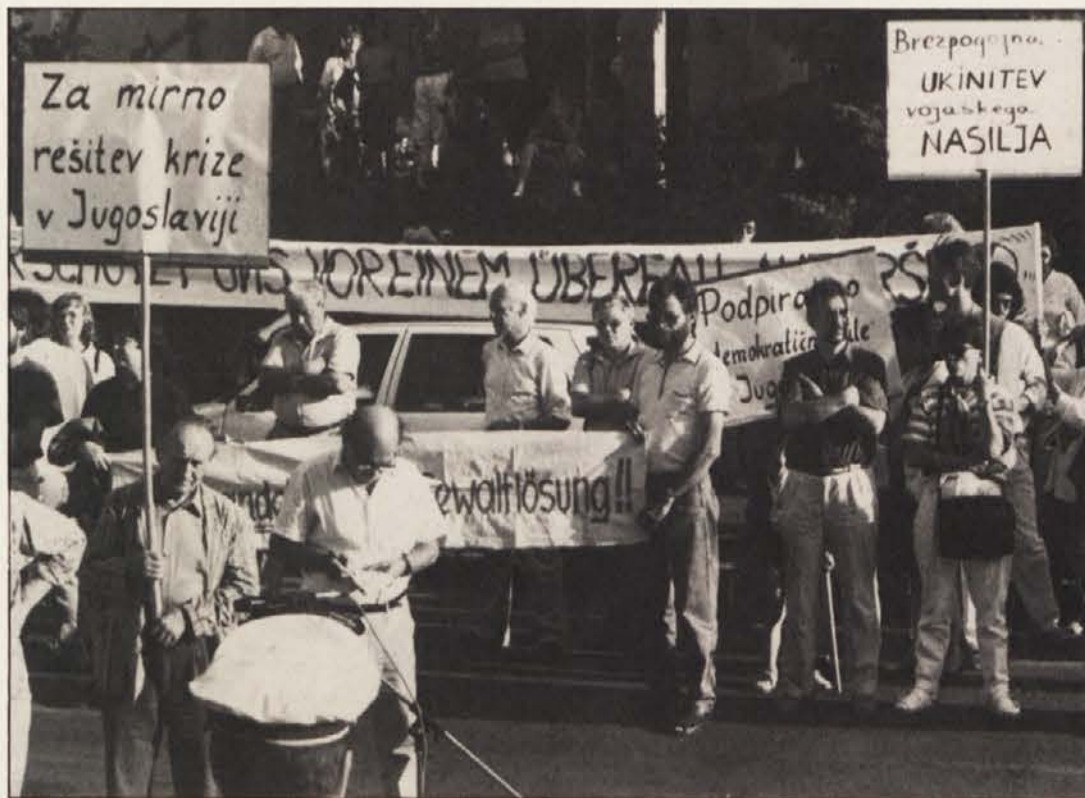
Že drugič v štirih dneh so se pred generalnim konzulatom SFRJ v Celovcu zbrali slovensko in nemško govoreči Korošci in odločno protestirali proti krvavi vojaški agresiji nad Slovenijo.