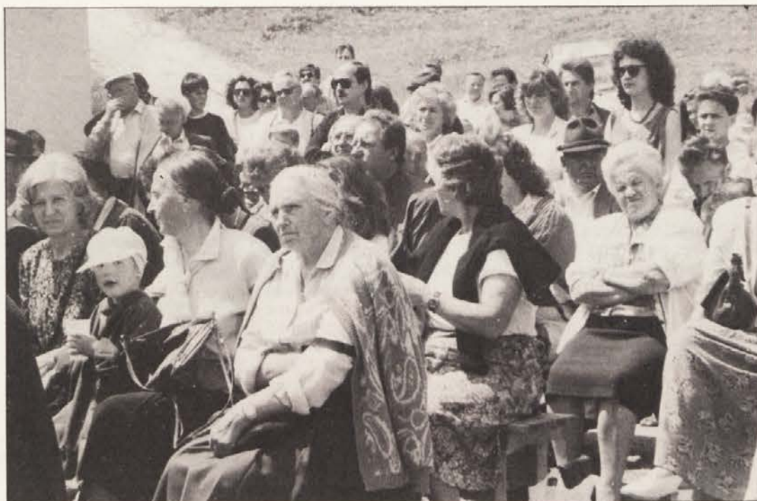
Udeležba na tovariškem srečanju je bila kljub razmeram v Sloveniji številčna