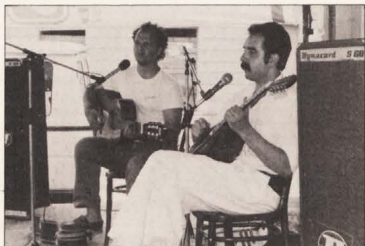
Kostas in Janis sta navdušila z grško glasbo