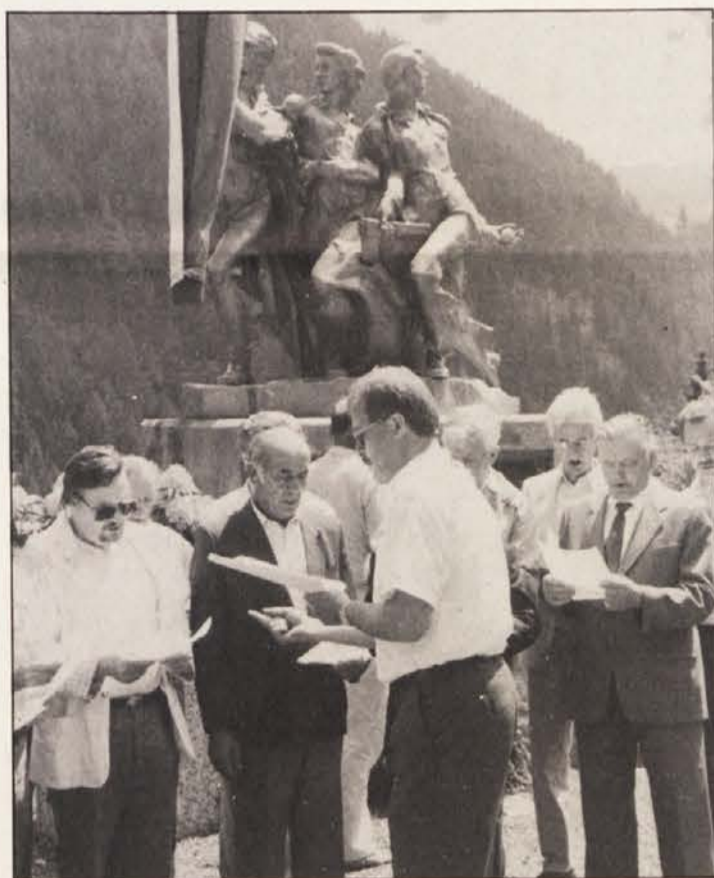
Pred spomenikom je zapel moški pevski zbor „Foltej Hartman“

Republika Slovenija svoj razvoj utemeljuje na načelih in merilih tiste evropske demokracije, ki je zrasla iz temeljev zmagovitega antifašističnega boja demokratičnih narodov sveta. Državna osamosvojitve Slovenije nikakor ne sme biti povod za vojaški obračun, temveč je v procesu evropeizacije nujna opcija, da je vsa odprta vprašanja jugoslovanske krize treba reševati le po miroljubni poti brez