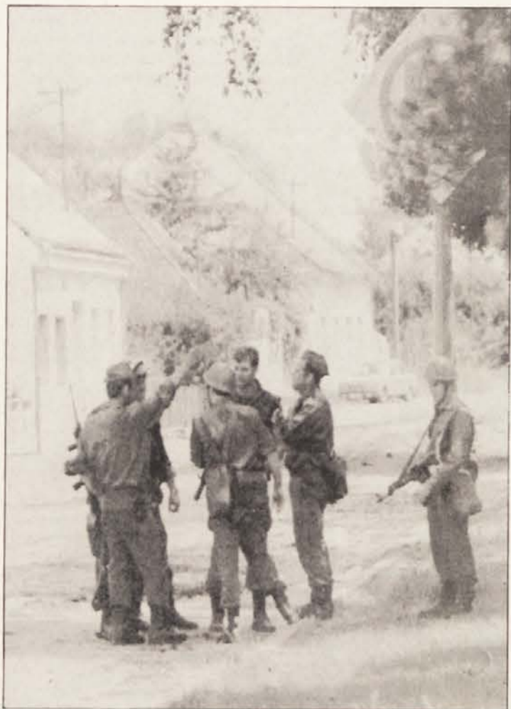
Slovenski vojaki so zastražili vse pomembne objekte