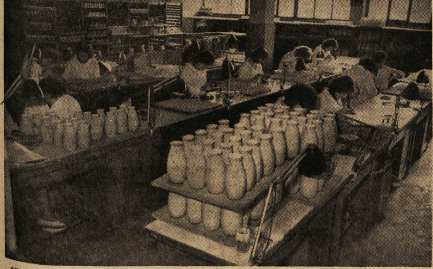
SKRIBNE IN SPRETNE ROKE MLADIH SLIKARK V SLIKARNICI HRASTNIK PRI DELU, LETOS, 29. NOVEMBRA. ZO KOLEKTIVU STEKLARNE HRASTNIK PROSLAVIL 100-LETNICO OBSTOJA STEKLARNE IN 10-LETNICO DELAVSKEGA SRAVILJANJA Z NOVIMI DELOVNIMI ZMAGAMI IN BOGATIM PROGRAMOM KULTURNIH PRIREDITEV

Sekretariat okrajnega komiteja Zveze komunistov Ljubljane, je po pooblastilu okrajnega komiteja sklenil, da bo konferenca Zveze komunistov ljubljanskega okraja 25. in 26. novembra. Konferenci bo prisostvovalo okrog 400 delegatov, izvoljenih v osnovnih organizacijah Zveze komunistov. Na dnevnem redu bosta poročilo o delu okrajnega komiteja in referat o nekaterih nalogah Zveze komunistov ljubljanskega okraja v bodočem obdobju.