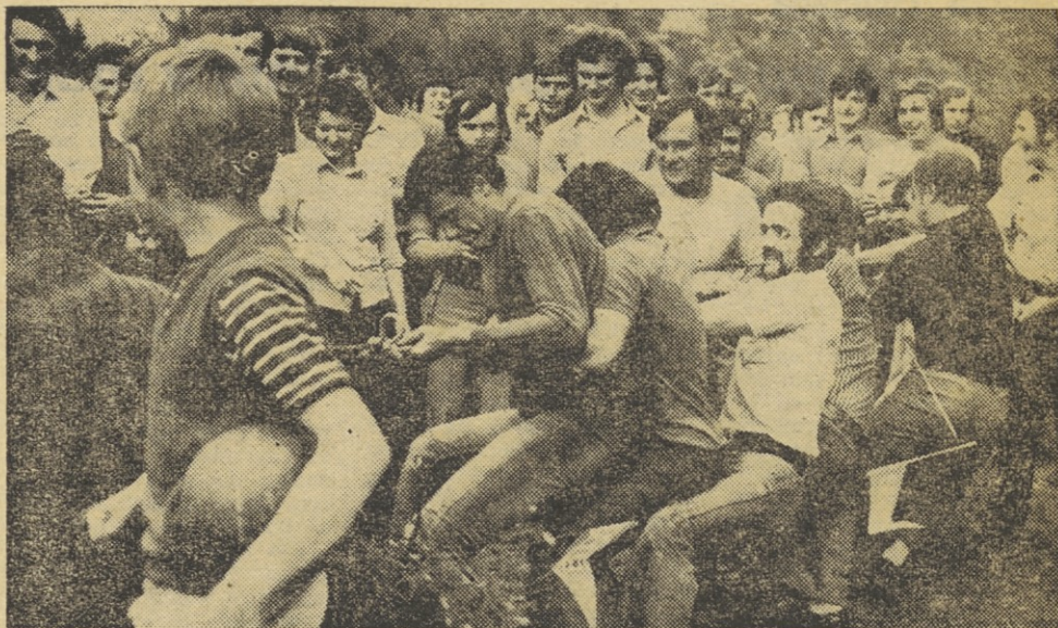
Mladi Iskraši so se na srečanju »ZAVRŠNICA '73« prijetno zabavali. Med drugim so se pomerili tudi v vlečenju vrvi