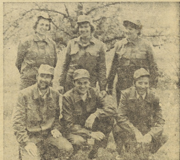
Ekipa prve pomoči civilne zaščite v kranjski Iskri, ki je na občinskem tekmovanju v letošnjem letu dosegla tretje mesto

lovna mesta, oz. nazivi: glavni direktor, pomočnik glavnega direktorja, direktor programsko-investicijskega sektorja, direktor finančnega sektorja, direktor komercialnega sektorja, direktor sredstev, vodja službe za organizacijo, referent za samoupravne in upravne zadeve, vodja permanentne inventure, permanentni inventurist, direktor TOZD.