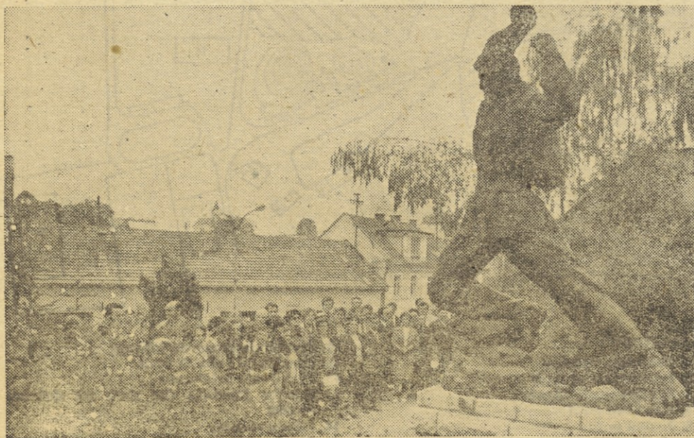
Udeleženci izleta pred spomenikom belokranjskemu partizanu v Metliki

Pri obravnavi uresničevanja ustavnih dopolnil, je organizacija sprejela sklep, da se izvrši prehod na eno TOZD (celotna tovarna), ki bi trajala največ leto dni. To izhodišče predstavlja, da je potrebno v tem času izvršiti organizacijske in samoupravne spremembe. Te spremembe naj bi zagotovile neposredno samoupravo na osnovi delovnih skupin in po delegatskem sistemü samoupravljanja tovarne. To organiziranje naj omogoči normalen prehod in ustanovitev več TOZD. V smislu tega sklepa je v izdelavi program te uresničitve in upam, da bo v najkrajšem času v širši razpravi — v celotnem kolektivu, Menim, da je nujno potrebno vsem članom kolektiva raztolmačiti kaj predvidevajo ustavna dopolnila, kaj se lahko spremeni, predvsem pa obrazložiti zaposlenim, kaj so to temeljne organizacijske zruženega dela (TOZD). Tudi na tem področju nas čaka veliko družbenopolitičnega dela, predvsem pa odločitev. Le dobro informiran delavec lahko odločal