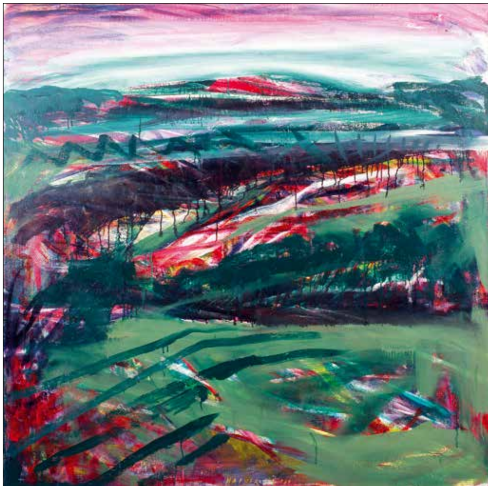
Janez Hafner, 2, 1989; akril/platno, 130 x 130 cm.