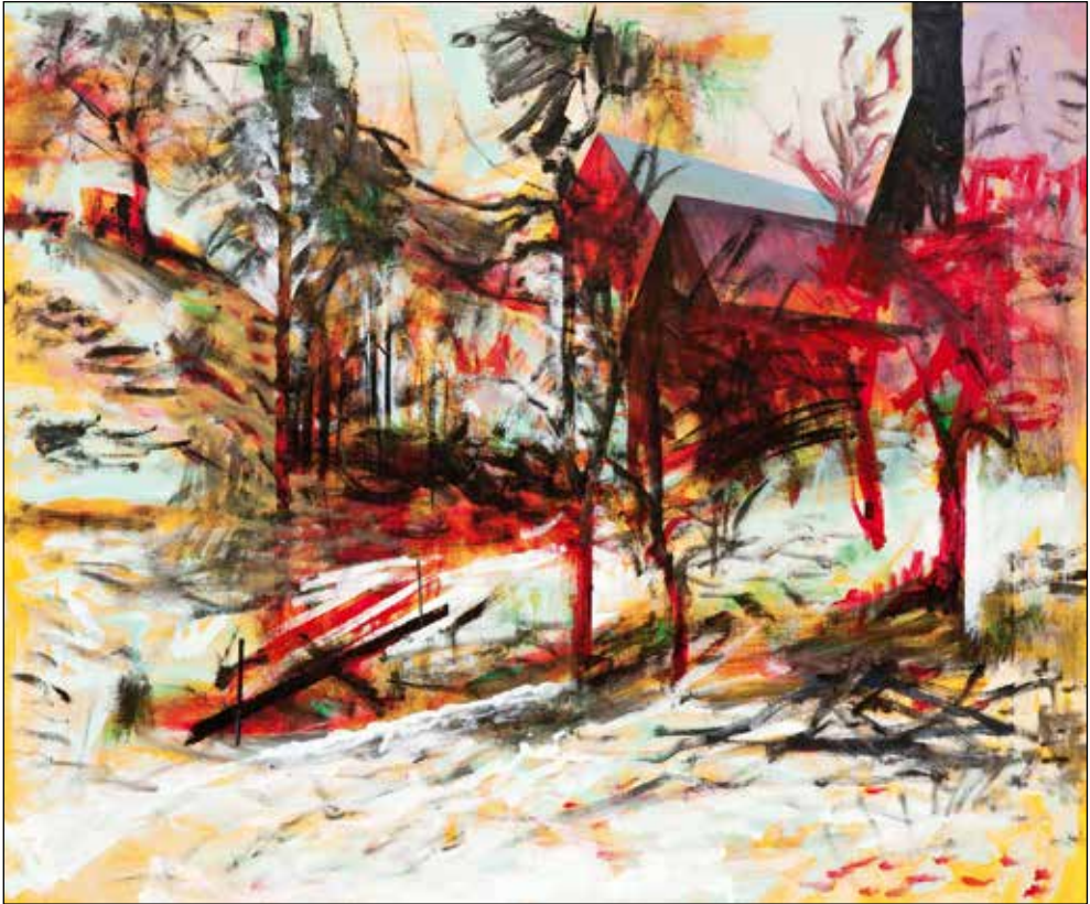
Janez Hafner, Drevesa , 2009; akril/platno, 100 x 135 cm.