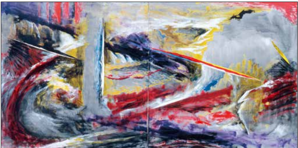
Janez Hafner, Vrtinec apokaliptične krajine , 1993; akril/platno, 100 x 200 cm.