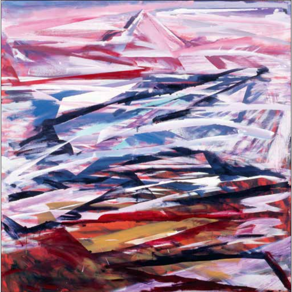
Janez Hafner, 3, 1989; akril/platno, 130 x 130 cm.