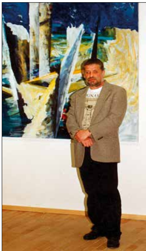
Samostojna razstava na Loškem gradu leta 1997.

Nekoč pa je razložil, kako mu ni bilo všeč, ko ste pripravili mizo z Miklavževimi darili, in da je vse zložil na tla, pogrnil prt in potem na poseben način zložil nazaj.