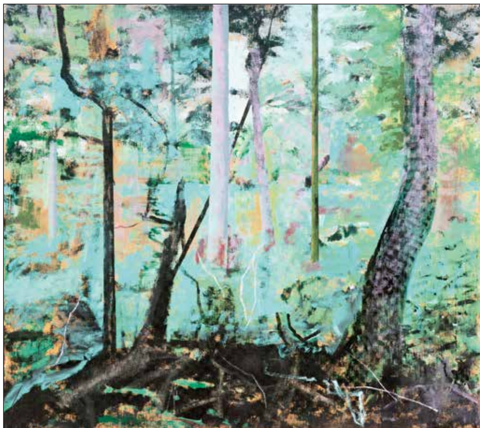
Njegova čisto čista zadnja slika, ki jo naslikal čez sliko ceste. Še vedno se odlično opazi tekstura blaga, na katerega je slikal. Na teh zadnjih slikah je bila zelo prisotna oker barva, ki mu je bila v zadnjem obdobju zelo všeč.

Ja, spet je slikal na platno. Na koncu, ko je bil že precej bolan, ni imel več volje, da bi sam napenjal blago, zato sem mu šla iskat že narejena, napeta in grundirana platna velikosti 70 x 100. Dejal je: "Ti mi kar tista prinesi, saj so čisto v redu." Sam je doslikal podlago po svoji izbiri in je bilo. Tako da je nazadnje delal samo te formate, 70 x 100. Edine večje slike, ki jih je v svojem zadnjem obdobju še naredil, so bile tiste, ki jih je na-