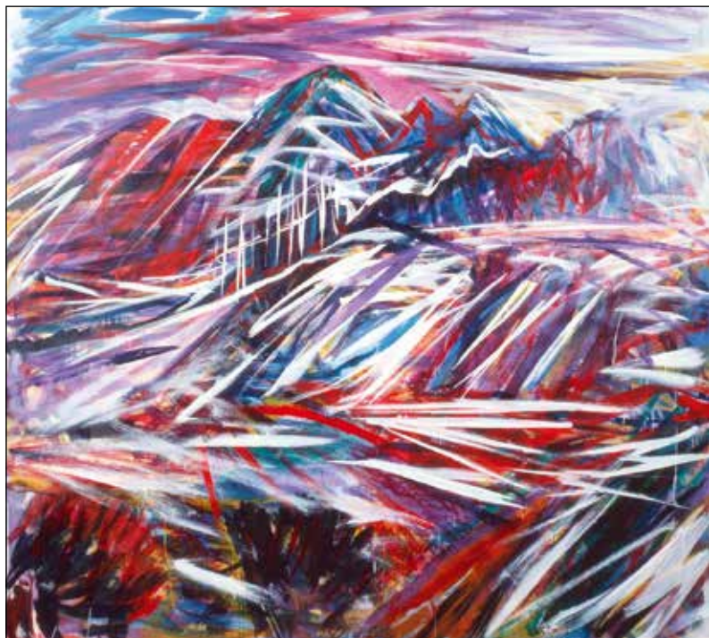
Janez Hafner, Božična krajina , 1989; akril/platno, 135 x 165 cm.