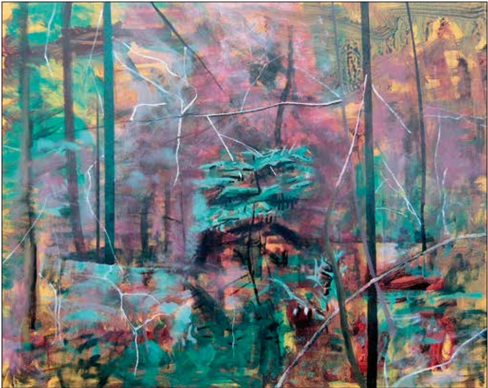
Janez Hafner, Smrekica , 2012; akril/platno, 80 x 100 cm.

Pregled njegovega opusa je pripravil Tomaž Lunder.