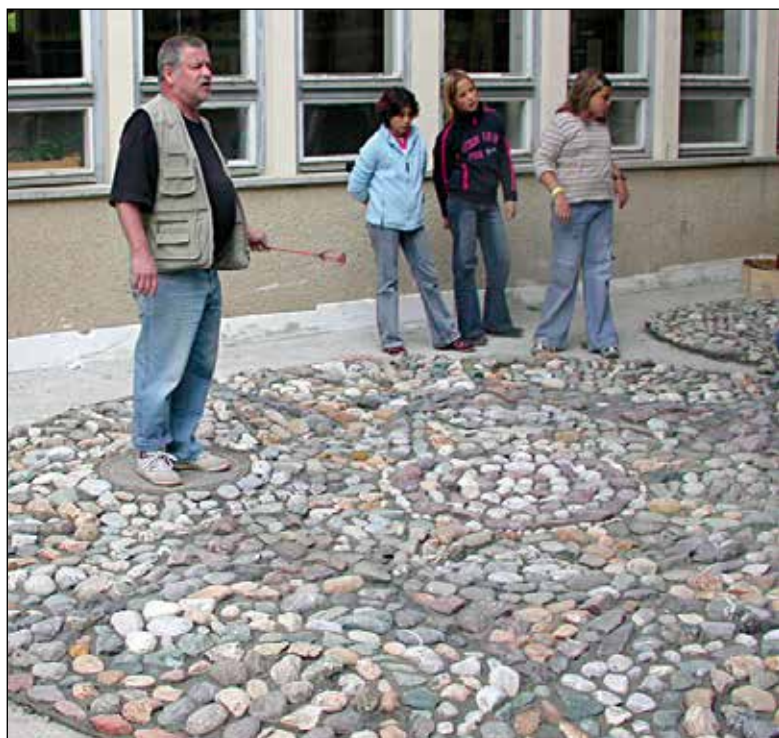
2006/2007, Izdelava mozaika, učenci pri urah likovnega pouka.