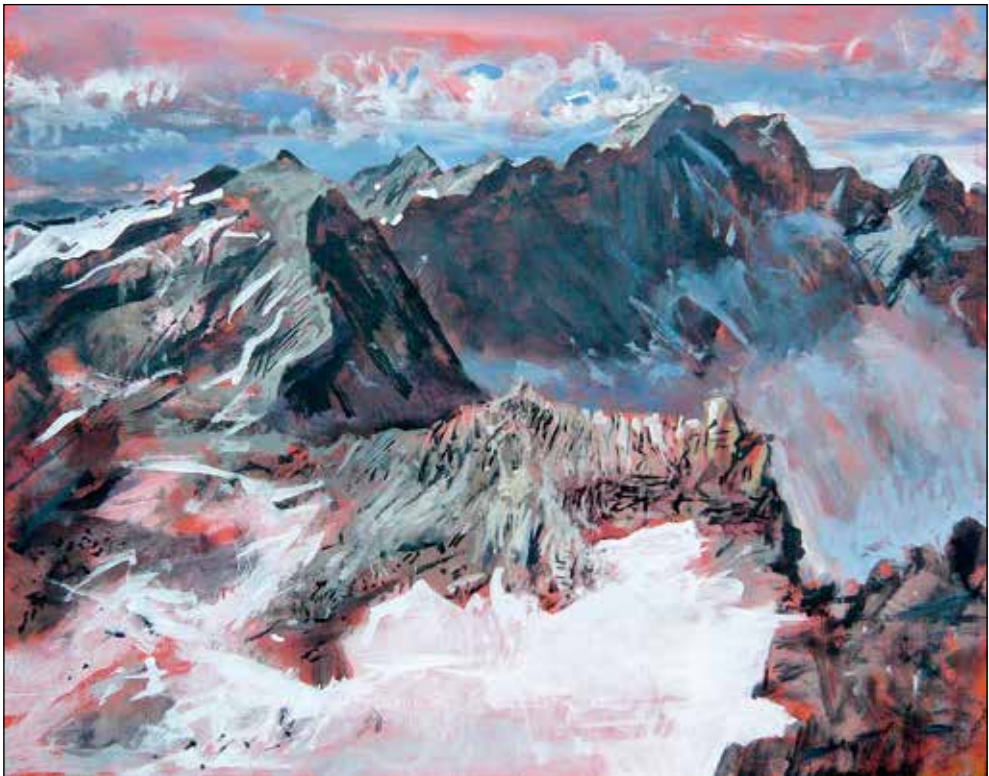
Janez Hafner, Gora Hafner 3067 m , 2012; akril/platno, 70 x 100 cm.