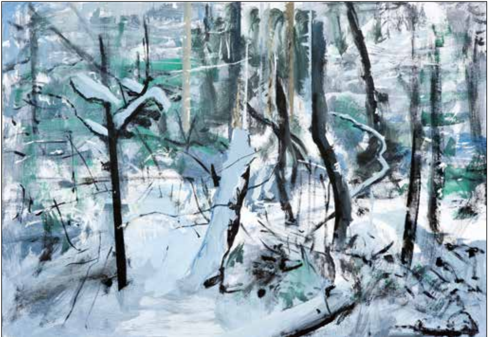
Janez Hafner, Zasnežena drevesa III , 2012; akril/platno, 70 x 100 cm.