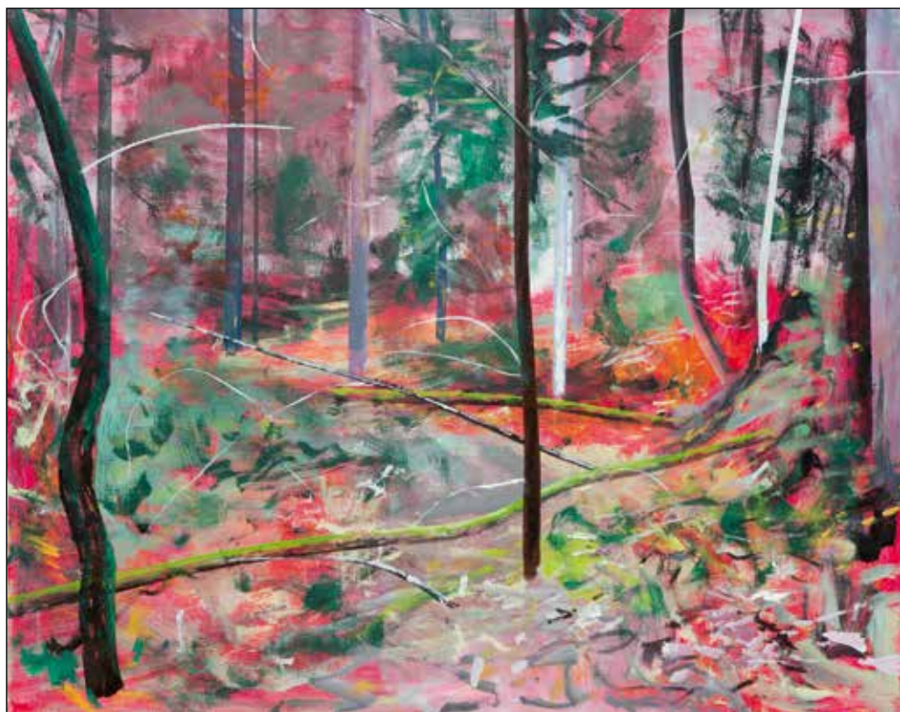
Janez Hafner, Ležeče , 2011; akril/platno, 80 x 100 cm.