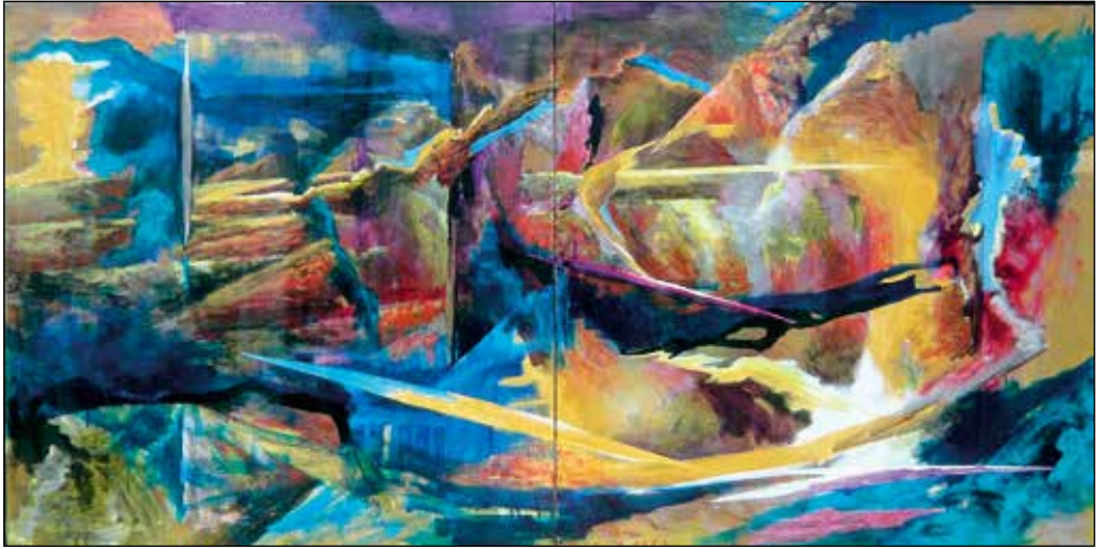
Janez Hafner, Žrelo , 1993; akril/platno, 100 x 200 cm.