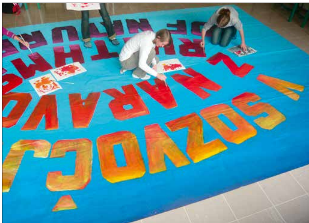
2010/2011, Izdelava scene za prireditev "V sozvočju z naravo" v okviru projekta Comenius.