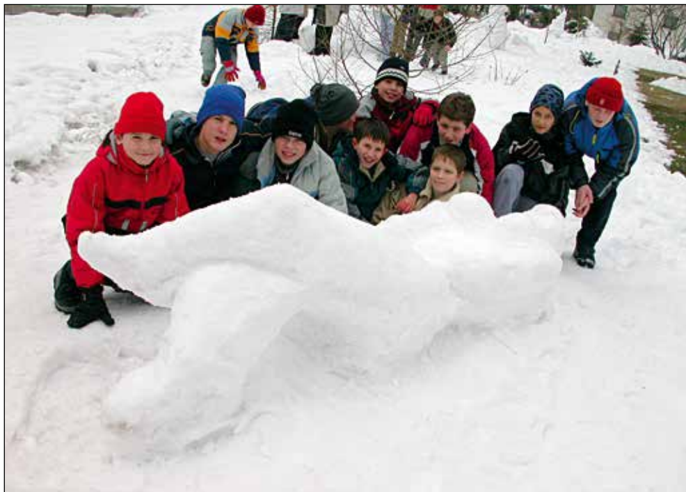
2003/2004, Kip iz snega, učenci 7. b. Učenci so oblikovali v različnih materialih in z različnimi materiali: milo, šolska kreda, glina, les, siporeks, žica, odpadna embalaža ...